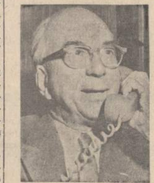
Lewis L. Strauss, kurį Senato komercijos komitetas 9 balsais prieš 8 balsus patvirtino prekybos sekretorium.

— Pipynės naujas Lietuvos rekordas. Lietuvos lengvosios atletikos varžybose naują Lietuvos rekordą pasiekė Jonas Pipynė, nubėgęs 3,000 metrų per 8 min. 15.6 sek. (E)