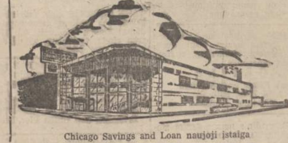
Chicago Savings and Loan naujoji įstaiga

SOPHIE BARCUS RADIJO VALANDA Visi programai iš WOPA, 1490 kil. AM 102.7 FM Kasdien: nuo pirmadienio iki penktadienio 10-11 val. ryto. Šeštadienį ir sekmadienį nuo 8:30 iki 9:30 val. ryto VAKARUSKOS: pirmad. 7 val. v. Tel.: HEMlock 4-2413 7159 S. MAPLEWOOD AVE. CHICAGO 29, ILL.