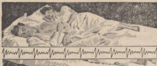
Recorded heart beats showed sounder sleep on Beautyrest. Research was conducted at the United States Testing Co. using methods developed by the Sleep Research Foundation.

FOR 11 years people like you went to sleep in laboratory sleep rooms. All leading types of mattresses were rotated through the rooms.