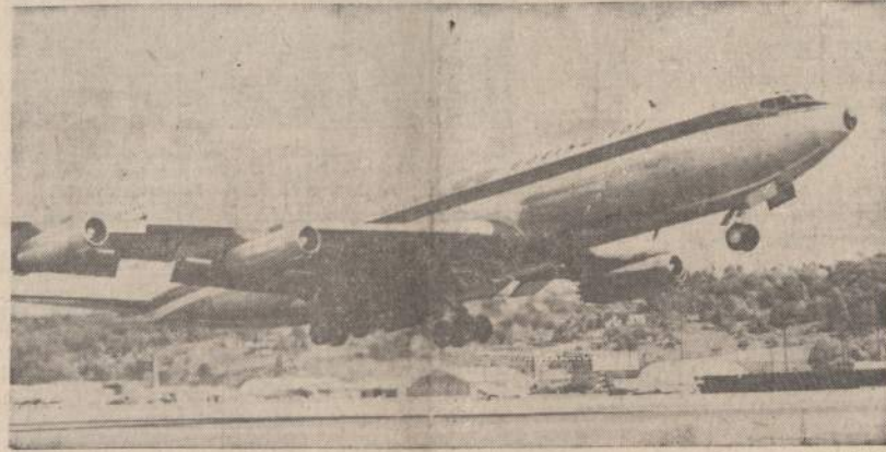
Komerčinis srausminis lėktuvas, kuris iš Seattle, Wash., be sustojimo nuskrido į Romą, Italiją, per 11 valandų ir 6 minutes. Jis skrido 39,000 pėdų aukštumoje 527 mylių greitumu per valandą. Lėktuvu gali skristi 189 žmonės.

Mokesčiai iš aprašomųjų aukštosios visuomenės narių turėtų išrinkti laikraščiai ir gautų už tai 10%. Bet visi laikraščiai, išskyrus pačių revoliucionierių, nenori nei tu procentų, nei mokesčių įstatymo.