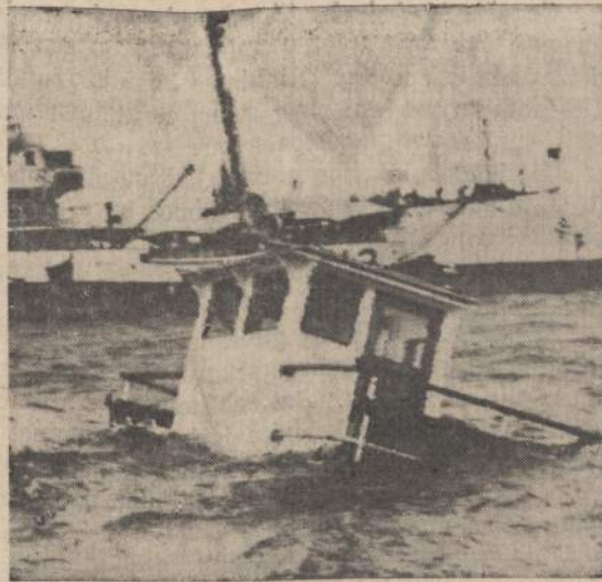
Keltuvas "Otreco", susidūręs su laivų vilkiku, nugrimzdo į dugną Rio Bay įlankoje prie Rio de Janeiro, Brazilijoje. Keltuve buvo apie 150 žmonių. Prisibijoma, kad daug žmonių nugrimzdo į dugną kartu su keltuvu.