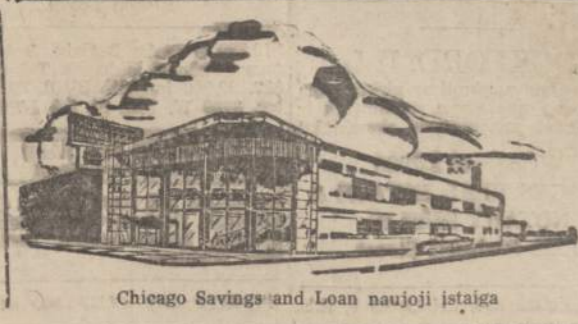
Chicago Savings and Loan naujoji įstaiga