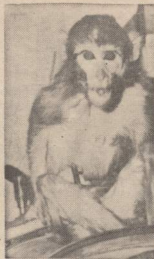
Didesnioji, 7 svaru, rhesus veislės beždžionė, kuri su kita mažyte, voverine beždžionike, buvo Jupiterio raketa iššautos į erdves ir sveikos grįžo žemėn, dabar nustupo po operacijos, kai daktarai bandė išimti jai iš po odos įtaisytus elektrodinius prietaisus, kuriais skrendant erdvėmis buvo registruojamos jos kūno funkcijos.

Iškėlus klausimą, kaip Vokietijos lietuviai reaguoja į koegzistenciją tarp mūsų ir Lietuvoje likusiųjų, prelegentas pasakė, jog jam teko apie tai kalbėtis su nesena atvažiuosiais iš Lietuvos, ir jie užakcentuoja, jog koegzistencijos niekad negali būti ir nebūti. Nors sąmoningo rusinimo dabar Lietuvoje nėra ir lietuviškumas yra didesnis, negu bet kada, bet kad būtų galima turėti kultūrinį ben-