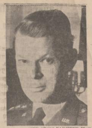
Europos karo palygū vyriausias vadovas gen. Lauris Norstas-pasakė, kad Nikitos Chruščiovo grasinimai ir ginčai iš Albanijos žvaginimai Vakarų ne kiek neįsigadino. Kalbėdamas Atlanto kongrese Londone Norstas pareiškė, kad Chruščiovas kelione į Albaniją pasirinko savo "tolimo laudy-mo ginklų" nevykusiai reklamai.