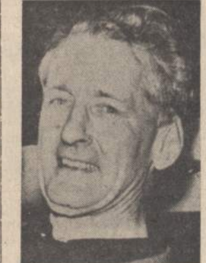
Lakūnas Max Conrad sumušė ilgo perskridimo nesustojus rekordą vienmotoriniame lėktuve. Jisai nuskrido 6,985 mylias iš Casablanca, Afrikoje, iki El Paso, Texas, kur nenusileidęs pranešė per radiją, jog jis skrenda dar 701 mylias iki Los Angeles.

Jį iškėlė savo papilvę didelės bombonešis ir paleido 38,000 pėdų aukštį. Pratimuose X-15 nenaudojo savo jėgos. Lakūnas leidosi į aerodromą kaip su sklandytuvu, išvystydamas greitį iki 250 mylių per valandą. Bandymai laikomi pasėkmingi.