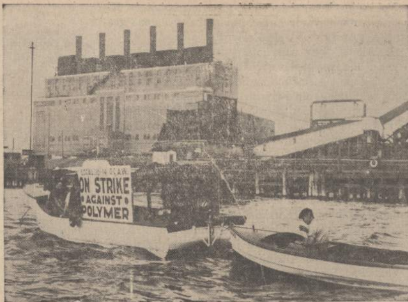
Marinų piketai patulioja St. Clair upės dokus prie Port Huron, Michigan, kur jau 11-tą savaitę streikuoja Polymer Corp. darbininkai.