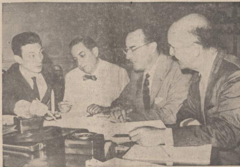
Brazilijos, Meksikos, Urugvajaus ir Jungtinių Valstybių "keturių tautų komitetas" susirinko Washingtone aptarti, ar ginkluotas konfliktas Ni'karaguoje gresia Amerikos kontinento saugumui.

QUINCY, Ill. — Seniausias jėzuitų katedras Amerikoj, užėjęs naujam daktarų laipsniui dalinimo sezonui, nusižiūrėjo į Louella Parsons, Hollywoodo gandise. Ji gavo literatūros garbės daktaro diplomą. Priešais spaudos skaitytojai dariesi iš jos išgirsta pirmiausia, kas Hollywoodo ruošiasi skirtis, kokie nauji meilės trikampiai, kas susilauks už 6, 7 kartais ir už 8 mėnesių vaiką ir t. t.