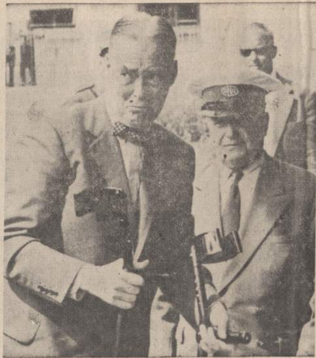
JAV valst. sekr. Christian A. Herter atvykęs dalyvauti keturių "didžiųjų" užs. reik. ministrų slapta pasėdyje Genevoje.