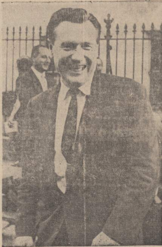
New Yorko gubern. Nelson Rockefelleris, kuris buvo nuskrėpęs į Washingtoną, po pusės valandos pasikalbėjo su prez. Eisenhower'ym pasidomai aplėdžia Baltuosius Namus. Jis sakėsi su prezidentu kalbėjėsis "bendromis legislatūros problemomis".