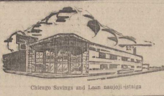
Chicago Savings and Loan naujoji įstaiga

CHICAGO SAVINGS TURTAS VIRŠ $30,000,000.00. Visų taupytojų pinigai yra pilnai apdrausti per Federalinės valdžios įstaigą. Visuomet išmokamas augstas dividendas. Perkanties arba statantiems namus paskolos duodamos lengvomis sąlygomis. Taupytojams teikiama daug patarnavimų nemokamai.