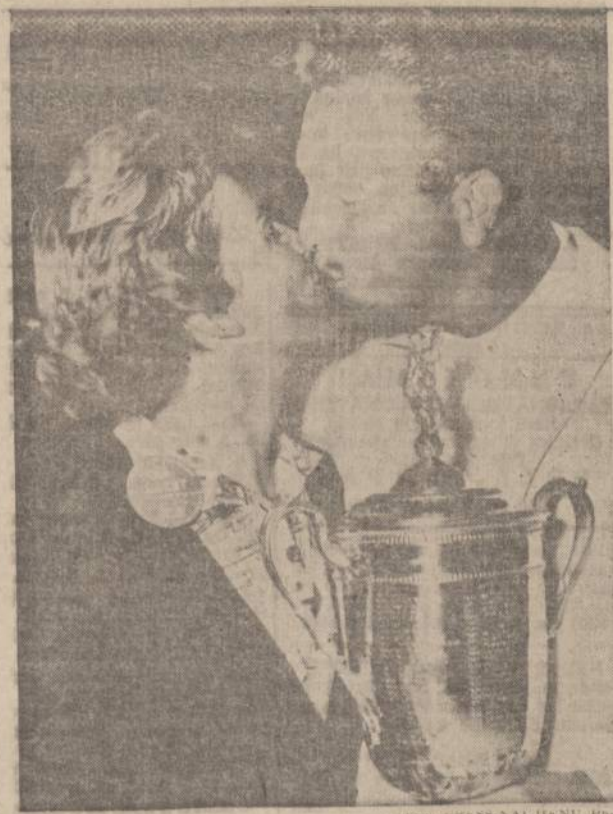
Golfo lošikas Billy Casper iš Apple Valley, Cal., laimėjęs U. S. golfo turnamente prie Mamoroneck, N. Y. ir gavęs pirmąjį $12,000 prizą, gauna priedo iš savo žmonos buki.

NAUJIENOS, 1739 S. Halsted Street, Chicago 8, Ill.