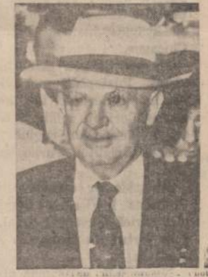
Louisianos gubernatorius Earl Long, suvargęs ir išbūgnęs, bando nusišypsoti spaudos atstovams teismo rūmuose Galvestone, Tex., kur jis atvyko lūdyti pats savo reikalu.

"NAUJIENOS" KIEKVIENO DARBO ŽMOGAUS DRAUGAS IR BICIULIS.