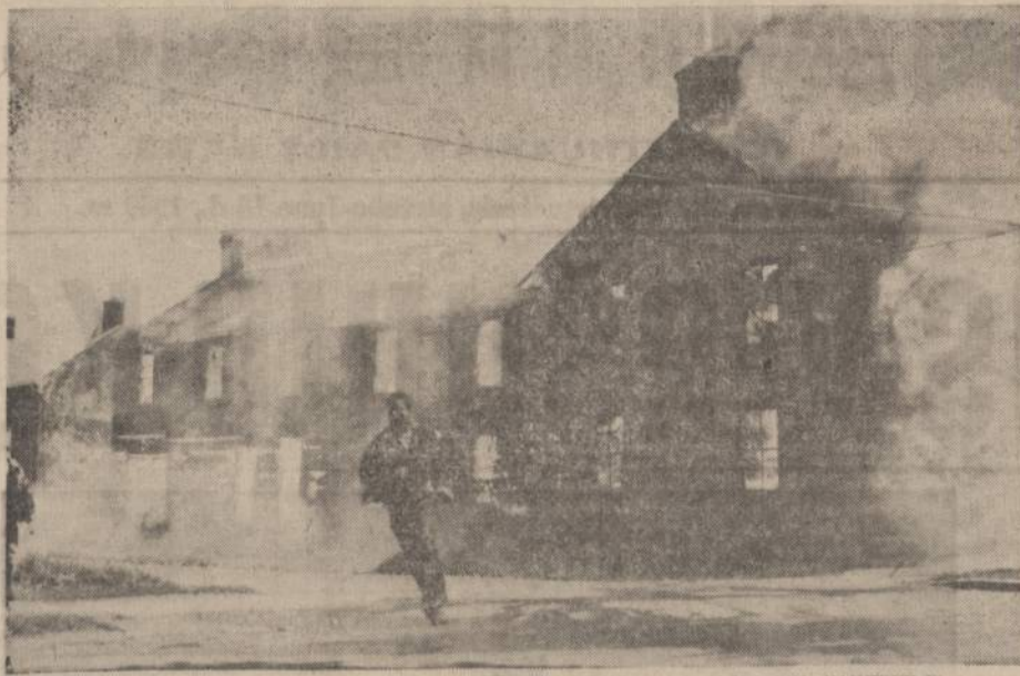
BEGA NUO "PRAGARO LIEPSNOS". Lanark, Ont., Kanadoje, užsidegus baldų dirbtuvei sudegė to miestelio 43 namai ir 30 krautuvių. Kunigas, mstes gaisrą, sako, kad "ugnis buvo pragariška".

Rinktinės sąstatas tuo tarpu dar nežinomas. Šiomis dienomis įvyks treniruotės ir rungtynės, kurių metu bus sudaryta krepšinio rinktinė iš pačių geriausių sportininkų.