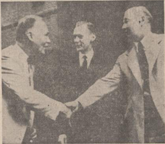
JAV valst. sekretorius Christian Herter (kairėje) sveikinasi su britų už. reik. sekretoriumi Selwyn Lloyd (dešinėje) ir prancūzų už. reik. min. Maurice Couve de Murville po posėdžio Genevoje, kuriame Vakarai sutiko neleisti atominių ginklų į Vakarų Berlyną ir prisiminti rytų Vokietijos komunistų kontrolę prie įvažiavimo ir išvažiavimo iš rytinės zonos.

Amerikos paviljonas Sovietų ruošiamoj parodoj Maskvoj kainuos $5 mil. Šią sumą sudėjo JAV vyriausybė kartu su privačiomis kompanijomis.