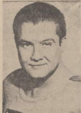
George Reeves, kuris filmose ir televizijoje vaidindavo "antžmogį" (Superman) rastas nusišovęs savo rezidencijoje Los Angeles. Luger pistoletas, kuriuo "antžmogis" persiėvė, rastas šalia numestas.

Infliacija Italijoje Namų savininkai skaudžiai nukentia nuo aukštų kainų ir nuomų kontrolės, nežiūrint, kur jų nuosavybės bebūtų. — Romoje, Paryžiuje, Chicagoje ar kur kitur. Kai bandoma kontroliuoti prekių kainas, tai dažnai tuo tik prisidedama prie juodosios rinkos klestėjimo. Pasiūnaudoja visokie spekuliantai. Namų savininkų padėtis yra