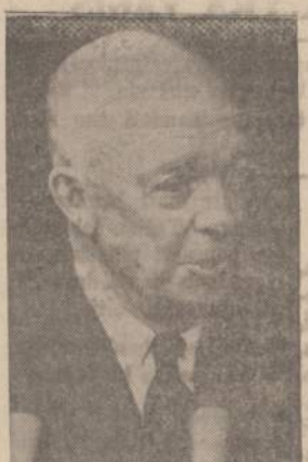
Prez. Eisenhower Washingtono konferencijoje pasakė, kad jis pareikalavo iš laivyno skubaus pranešimo, kodėl Amerikos lėktuvai ginklais neveikė, kai juos komunistų lėktuvai buvo užpuolę.