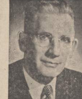
Sen. Paul Douglas

Nikita atvažiavo į garsiuosius revoliucionierių Ciegelskio fabrikuo kiek vėliau. Lenkų paskatinti pusmetį vėliau sukilo vengrai ir per kelias dienas nušlavė komunistų valdžią. Deja, po savaitės, priveržus Sovietams daugiau tankų divizijų, vengrų laisvės aušra vėl užtemo.