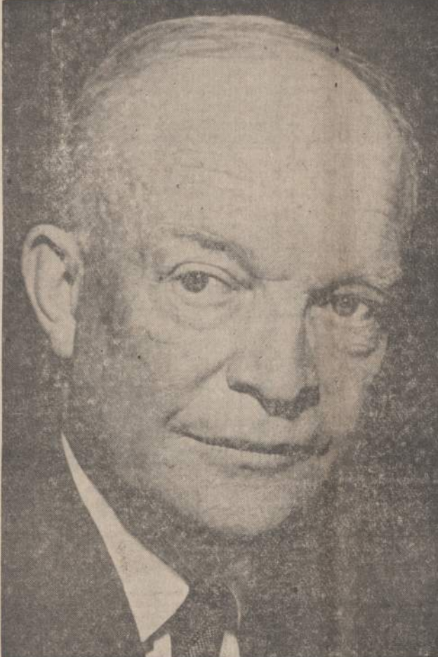
Prez. D. D. Eisenhower