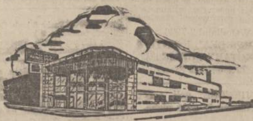
Chicago Savings and Loan naujoji įstaiga

6245 South Western Avenue Telef.: GROvehill 6-7575 ATDARA: Pirmadienį 12 iki 8, antradienį 9 iki 4, trečiadienį uždaryta visą dieną, ketvirtadienį ir penktadienį 9 iki 8, šeštadienį 9 iki 12:30 val.