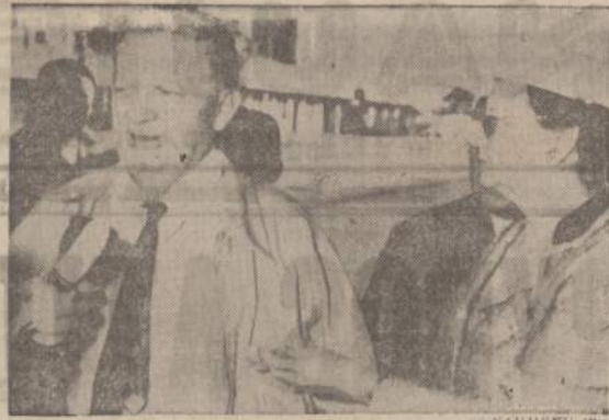
Louisianos gubernatorius Earl Long prieš grįždamas iš Galvestono, Texas, su savo žmona po rankos, kalbasi su reporteriais. Vėliau psichiatru patarimu pasijustas į valstybinę proto ligoninę.

—Nėra prasmės kad aš tamstai pasakočiau, — atsakė plėšikas. — Tam menui suprašti ir išmokyti reikalingi metai laiko.