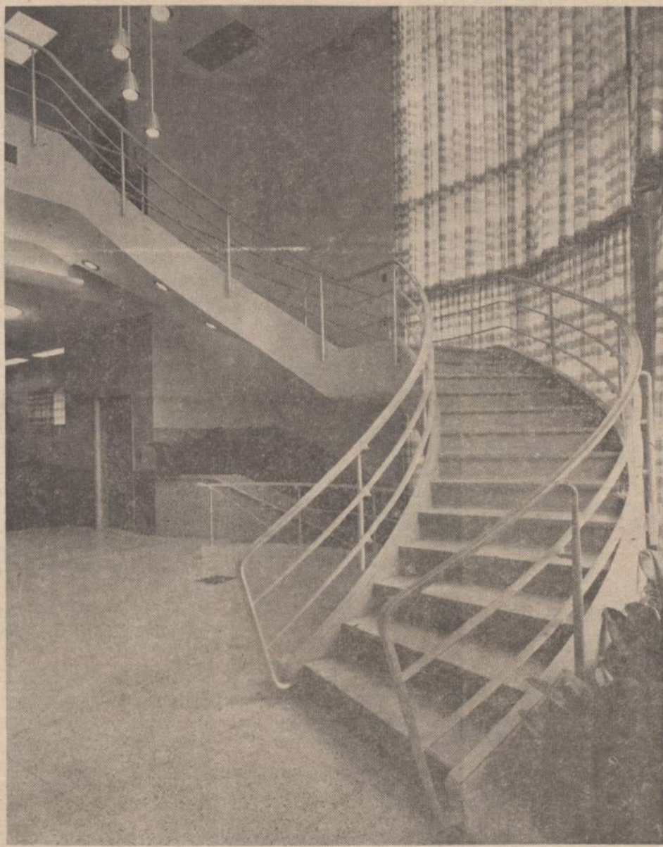
Chicago Savings įstaigos vidaus vaizdas. Dešinėje matome laiptus, kuriais lipama į antrą aukštą, kur paruošiami dokumentai paskoloms. Paveikslė viduryje matome žemyn einančius laiptus. Apačioje yra salės susirinkimams, seifai, vauktai. Toliau į kairę matome elevatorių, kuriuo galima pasiekti antras aukštą arba rūsys.

CHICAGO SAVINGS & LOAN BENDROVEI praeitas pusmetis buvo didžiausio biznio pusmetis. Per pirmus 6 šių metų mėnesius bendrovės turtas paaugo virš $6,500,000. Visas bendrovės turtas dabar yra didesnis, negu $36,000,000. Per tą patį laiką padarėm naujų paskulų daugiau negu $7,800,000 sumai. Visa bendrovės piniginė apyvarta per šiuos 6 mėnesius buvo apie $25,000,000. Taigi, kaip iš skaitmenų matote, pas mus yra didelio biznio apyvarta.