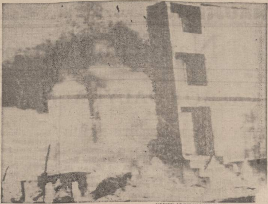
Stahlheim viešbutis Vossestrande, Norvegijoje, kur per gaisrą, kiek žinoma, žuvo 31 žmogus. Jų tarpe, prisibijoma, yra žymi dalis amerikiečių turistų.