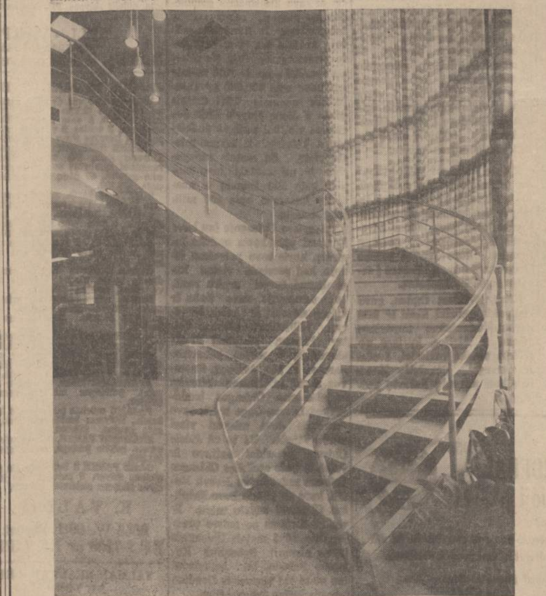
Chicago Savings įstaigos vidaus vaizdas. Dešinėje matome laiptus, kuriais lipama į antrą aukštą, kur paruošiami dokumentai paskoloms. Paveiklio viduryje matome žemyn einančius laiptus. Apačioje yra salės susirinkimams, seifai, vauitai. Toliau į kairę matome elevatorių, kuriuo galima pasiekti antras aukštas arba rūsy.

CHICAGO SAVINGS & LOAN BENDROVEI praeitis pusmetis buvo didžiausio biznio pusmetis. Per pirmus 6 mėnesius bendrovės turtas paauogo virš $6,500,000. Visas bendrovės turtas dabar yra didesnis, negu $38,000,000. Per tą patį laiką padarėm naujų paskulų daugiau negu $7,800,000 sumai. Visa bendrovės piniginė apyvarta per šiuos 6 mėnesius buvo apie $25,000,000. Taigi, kaip iš skaitmenų matote, pas mus yra didelio biznio apyvarta.