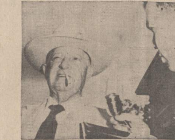
Louisianos gubernatorius Earl K. Long, kuris žmonos rekomendacija buvo padėtas į valstybinę proto ligų ligoninę, pagaliau iš ten paleistas, apskundė savo žmoną, kaltindamas žiaurumu ir reikalaujamas perskyry. Žmona pabėgusi tariamai į Meksiką.