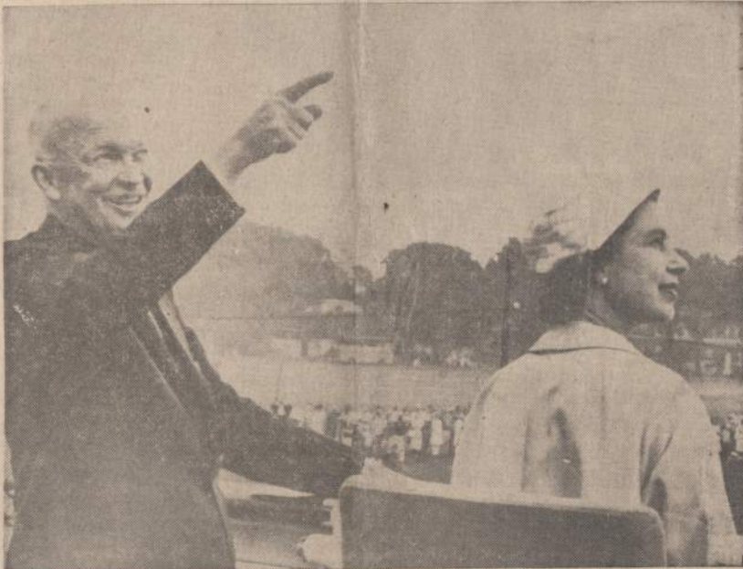
Prez. Eisenhower su angly karalene Elzbieta praplaukia karališkąja jachta Britannia pro tiltą prie St. Lamberto tvirtinimo išilgai St. Lawrence jūrų kelio netoli Montrealio.

Irake komunistai gavo savo vadovybes įsakymą ruoštis ir ginkluotai kovai su kurdais ir kitais antikomunistais, kurie įgauna vis didesnės įtakos generolo Kassimo vyriausybėje.