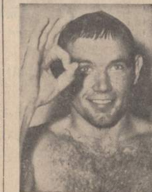
Naujasis pasaulinis bokso čempionas Ingemar Johansson, 26 metų švedas iš Goteborgo, Švedijos, šyposi Yankee Stadione, New Yorke, trečiajame runde technišku nokautu atėmęs iš Floyd Pattersono titulą.

Johansson pereitą penktadienį sukėlė pasaulinę sensaciją, nugalėdamas sunkaus svorio bokso čempioną Floyd Patterson trečiajame runde technišku nokautu. Kai jis per pusantros minutes 7 kartus parmušė čempioną ant grindų, teisėjas kumštynes nutraukė ir paskelbė Johanssoną nugalėtoju.