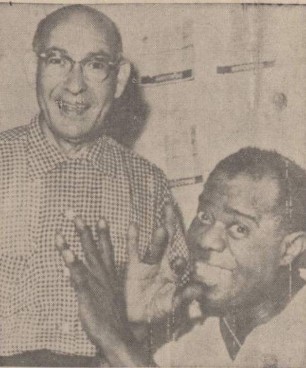
Louis "Satchmo" Armstrong, 59 metų džazo muzikantas, susirgęs plaučių uždegimu Spoleto ligoninėje, Italijoje, pradeda taisytis ir rodo savo doktorui rankomis, kaip jis pučia dūdas. Armstrongo plaučių uždegimas buvo labai pavojingas dėl to, kad bežipiantis dūdas per 45 metus jo plaučiai buvo labai išpurpę.