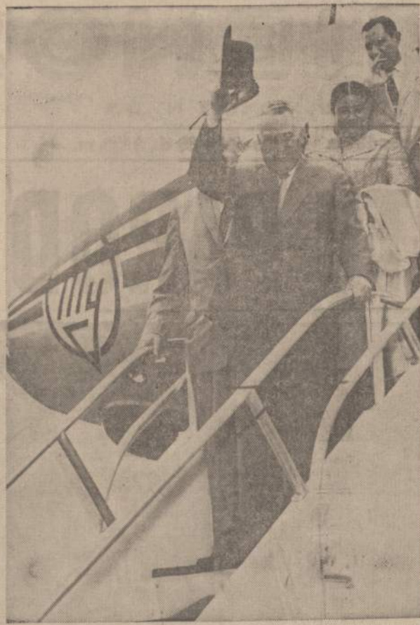
Pirmasis Sovietų Sąjungos vicepremjeras Frol R. Kozlovas, atskridęs iš Maskvos į Idelvid aerodromą New York'e rusiškoju tur-boprop lėktuvu TU-114. Kozlovas, kuris numatomas Chriščiūvo įpė-diniu, atvyko į JAV atidaryti sovietų parodos New York'e kolizijoje.