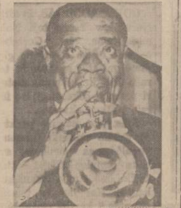
Louis "Salchimo" Armstrong, vienas žymiausių Amerikos džiazo muzikų, sunkiai susirgo Italijoje ir pa-dėtas į Spoleto ligoninę. Jo padėtis esanti "rimta".