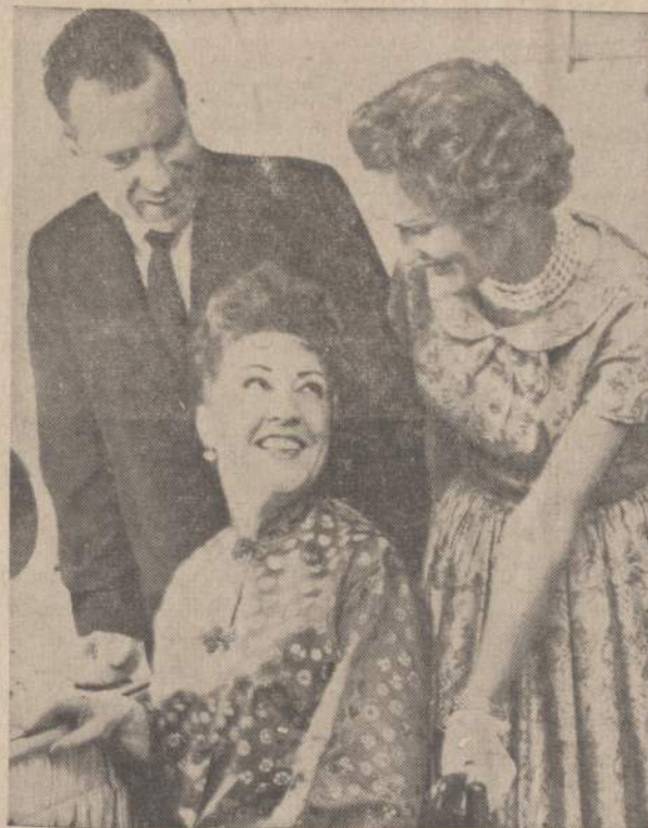
Viceprezidentas Nixon su savo žmona Pat (dešinėje) aplankė garsiąją dainininkę Ethel Merman Broadway teatre, New York'e, baigus muzikinį vaidinimą "Gypsy".