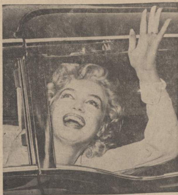
Marilyn Monroe, turėjusi operaciją vienoje New Yorko ligoninėje, grįžta namo pasveikusi.