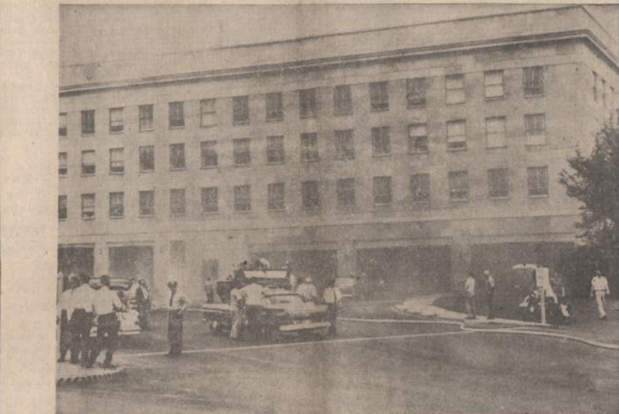
Milžiniškas gaisras krašto gynybos centre Washingtonė. Gaisras padarė nuostolių už 6 milijonus dolerių ir sunaikino labai svarbius dokumentus.

Sudegė 15 kalinių HELSINKIS, Suomija. — Pietinės Suomijos miestely vienas kalinys padegė medinį kalėjimą, kuris bemačiam supleškėjo ne tik su padegėju, bet ir kitais 14 kalinių. Kalėjimo sargai išgelbėjo tik vieną žmogų.