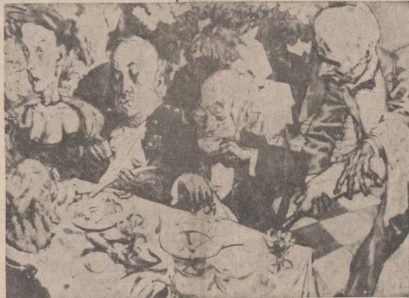
Jack Levine pieštas paveikslas, pavadintas "Sugrįžimas namo" (Welcome Home) yra vienas tu, kuriuos Amerikos meno ekspozicijoje atrinko siųsti į Amerikos parodą, rengiamą Maskvoje. Čia vaizduojamas namo grįžęs Amerikos generolas, valgantis pietus savųjų tarpe.

MASKVA. — Sovietų propagandinos dainos žodžiai sako, kad žmogus niekur taip lengvai nealsuoja, kaip Tarybų Sąjungoje. Šiomis dienomis jų mokslininkai patikslino, kad visų geriausias klimatas yra Sibire, apie kurį kita dainelė sako, kad ir "Sibiras rusiška žemė". Matyti, mokslininkai gavo įsakymą privilioti tokiomis kalbomis daugiau savanorių Chruščiovo pramonės ir žemės ūkio programai išpildyti.