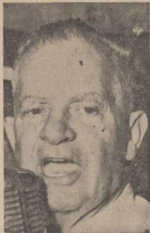
Earl K. Long, Louisianos gubernatorius, grįžęs iš proto ligoninės, pradėjo kampaniją už ketvirtą terminą ir taip smarkiai įsikalbėjo Lake Arthur mitinge, jog pats nebejučia musis ant savo kaktos.