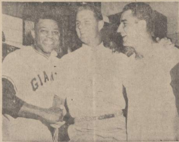
Willie Mays (kairėje), Don Drysdale (centr) ir Johnny Antonelli, trys National League didžiosios žvaigždės, nugalėję American League prie Forbes Field, Pittsburgh, penkiais prieš keturis.

Taigi FASKas turi vyriausių uždavinių pasistatyti tą prieauglį suvesti į reikiamą būvę prideramą mokymo ir auklėjimo aplinkai, kuri kasmet mums ugdytų stiprų ir sveikos minties atžalyną. Ši programa turi būti nuodugniai apdirbta, išdiskutuojant viską kas šiandien kitų