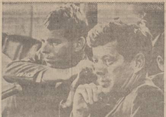
Robert F. Kennedy (kairėje) patvirtino gaudus, kad jis žada greitu laiku atsakyti iš Senato raketierių tyrinėjimo komiteto vyr. pareigū pareigū. Vaizde jis matomas su savo broliu, sen. John F. Kennedy (dem. iš Mass), kuriam jis žada pašvesti visą laiką, padėdamas kampanijoje už 1960 metais įvykstančias prezidento nominacijas.

NAUJIENŲ ofisas atdaras kasdien, išskyrus sekmadienius, nuo 9 ryto iki 5 val. vakaro. Seštadieniais — iki 12-tos.