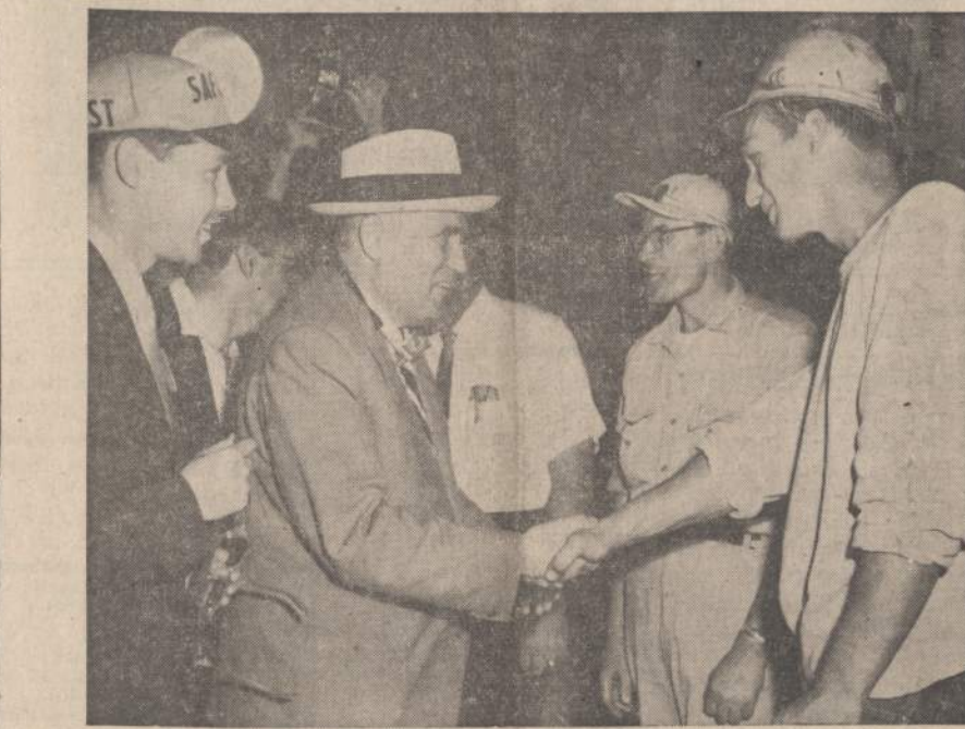
Sovietų vicepremieras Frol Kozlovas rodo didelę įspensą Inland Steel liejyklų darbininkams Rytų Chicagoje, Ind.

STOCKHOLMAS, Švedija. — Švedijos konservatorių ir liberalų partijų vadai Jarl Hjarlmanson ir Bertil Ohlin pranešė valdančiosios partijos (socialdemokratų) vyriausybei, kad jie nedalyvaus pietuose, kuriuos ruošia vyriausybė Nikitai Chruščevui, kai jis rugpjūčio mėnesį lankysis Skandinavijoje.