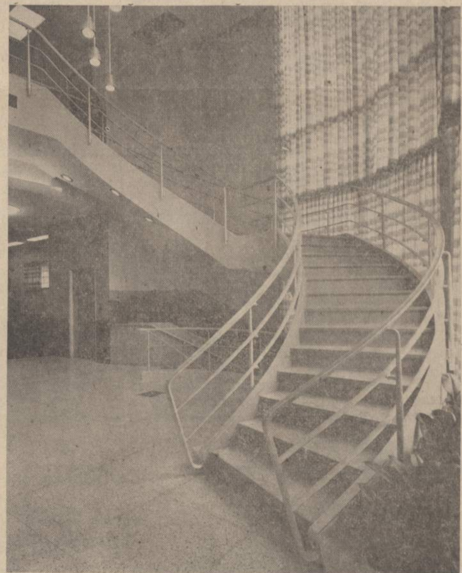
Chicago Savings įstaigos vidaus vaizdas. Dešinėje matome laiptus, kuriais lipama į antrą aukštą, kur paruošiami dokumentai paskoloms. Pavelsio viduryje matome žemyn einančius laiptus. Apačioje yra salės susirinkimams, seifai, vauliai. Toliau į kairę matome elevatorių, kuriuos galima pasiekti antras aukštas arba rūsy.

CHICAGO SAVINGS & LOAN BENDROVEI praėjus pusmetis buvo didžiausio biznio pusmetis. Per pirmus 6 šiu metų mėnesius bendrovės turtais paaugo virš $6,500,000. Visas bendrovės turtais dabar yra didesnis, negu $36,000,000. Per tą patį laiką padarėm naujų paskulų daugiau negu $7,300,000 sumai. Visa bendrovės pinigine apyvarta per šiuos 6 mėnesius buvo apie $25,000,000. Tai reiškia, kaip iš skaitmenų matote, pas mus yra didelio biznio apyvarta.