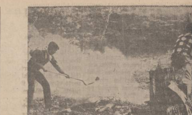
Daugiau kaip 2,000 vyrų įtemptai dirbaujai, stengdamiesi su-laikyti miško gaisrą prie Loyalton, California.

Duktė: Kodėl tu, mama, duo-di šukuoti plaukus "permanent"? Motina: Dėlto, dukrele, kad taip praktiškiau, ir nereikia plaukus šukuoti kasdien. Duktė (susimastę): Aš galvoju, ar aš negalėčiau kaklą nu-simazgoti "permanent".