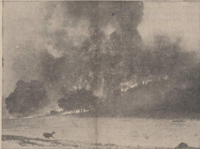
Didelis miško gaisras Hidden Valley, Kalifornijoje, vos kelios mylios nuo Los Angeles apskrities linijos. Gaisras gesinę 200 žmonių nieko tuo tarpu negalėjo padaryti. Vaizde matoma iš gaisro bėgančių stirma.

Pakeliui į pripažinimą Keistai atrodo berlyniečiams ir Vakarų šalių sutikimas leisti Rytų Vokietijos kariuomenei, policijai tikrinti transportus tarp Berlyno ir Vakarų Vokietijos, laikant juos tik Sovietų Sąjungos "agentais". Kaip jie juos ir bevardintų, tai būtų bene paskutinis žingsnis į Rytų Vokietijos faktišką pripažinimą.