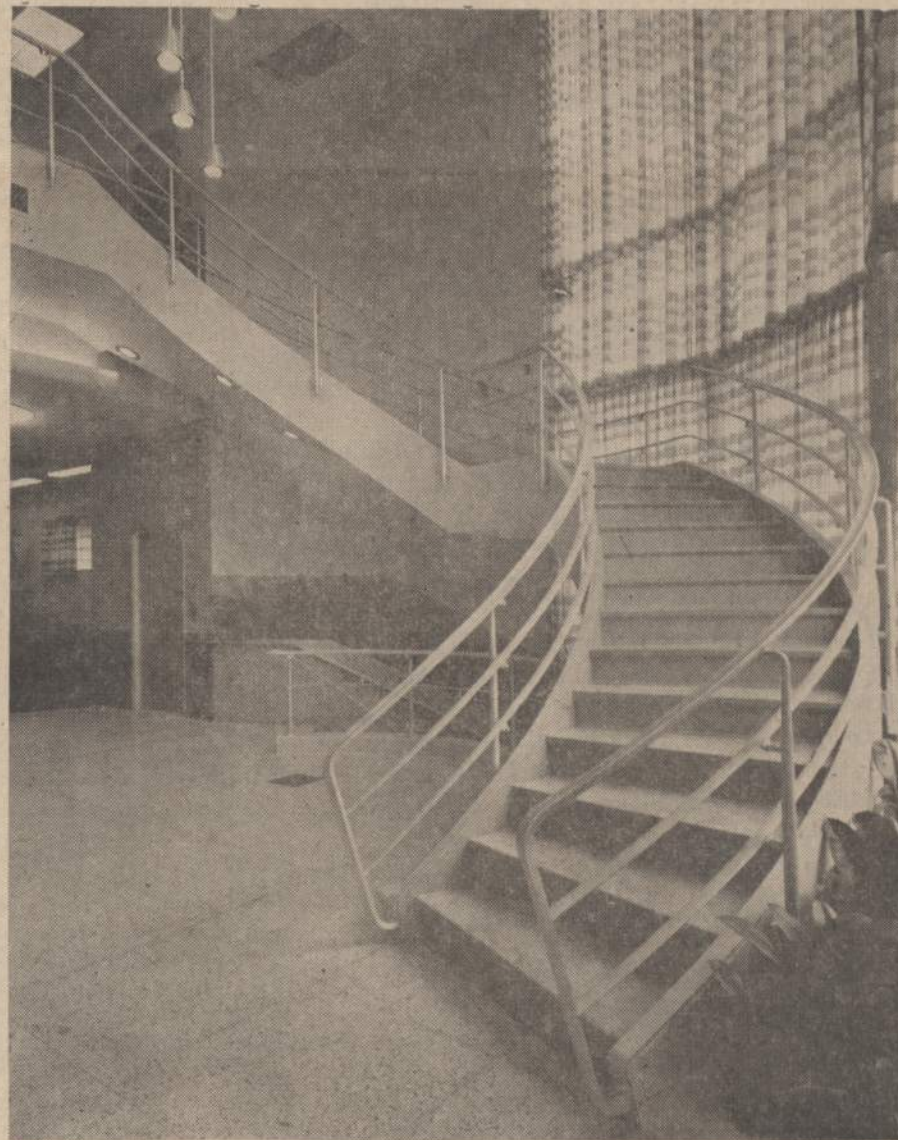
Chicago Savings įstaigos vidaus vaizdas. Dešinėje matome laiptus, kuriais lipama į antrą aukštą, kur paruošiami dokumentai paskoloms. Paveikslu viduryje matome žemyn einančius laiptus. Apačioje yra salės susirinkimams, seifai, vauktai. Toliau į kairę matome elevatorių, kuriuo galima pasiekti antras aukštas arba rūsy.

CHICAGO SAVINGS & LOAN BENDROVEI praeitas pusmetis buvo didžiausio biznio pusmetis. Per pirmus 6 šių metų mėnesius bendrovės turtas paaugo virš $6,500,000. Visas bendrovės turtas dabar yra didesnis, negu $36,000,000. Per tą patį laiką padarėm naujų paskulų daugiau negu $7,800,000 sumai. Visa bendrovės pinigine apyvarta per šiuos 6 mėnesius buvo apie $25,000,000. Taigi, kaip iš skaitmenų matote, pas mus yra didelio biznio apyvarta.