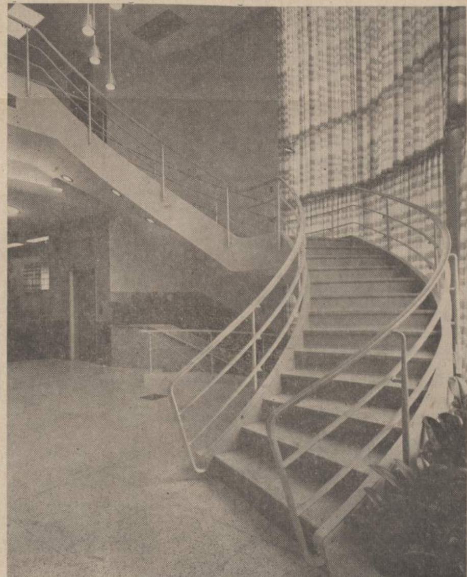
Chicago Savings įstaigos vidaus vaizdas. Dešinėje matome laiptus, kuriais lipama į antrą aukštą, kur paruošiami dokumentai paskoloms. Paveikslas viduryje matome žemyn einančius laiptus. Apačioje yra salis susirinkimams, seifai, vauktai. Toliau į kairę matome elevatorį, kurio galima pasiekti antrą aukštą arba rūsy.

CHICAGO SAVINGS & LOAN BENDROVEI praėjus pusmetis buvo didžiausio biznio pusmetis. Per pirmus 6 mėnesius bendrovės turtas paaugo virš $6,500,000. Visas bendrovės turtas dabar yra didesnis, negu $36,000,000. Per tą patį laiką padarėm naujų paskulų daugiau negu $7,800,000 sumai. Visa bendrovės piniginė apyvarta per šiuos 6 mėnesius buvo apie $25,000,000. Taigi, kaini iš skaitmenų matote, pas mus yra didelio biznio apyvarta.