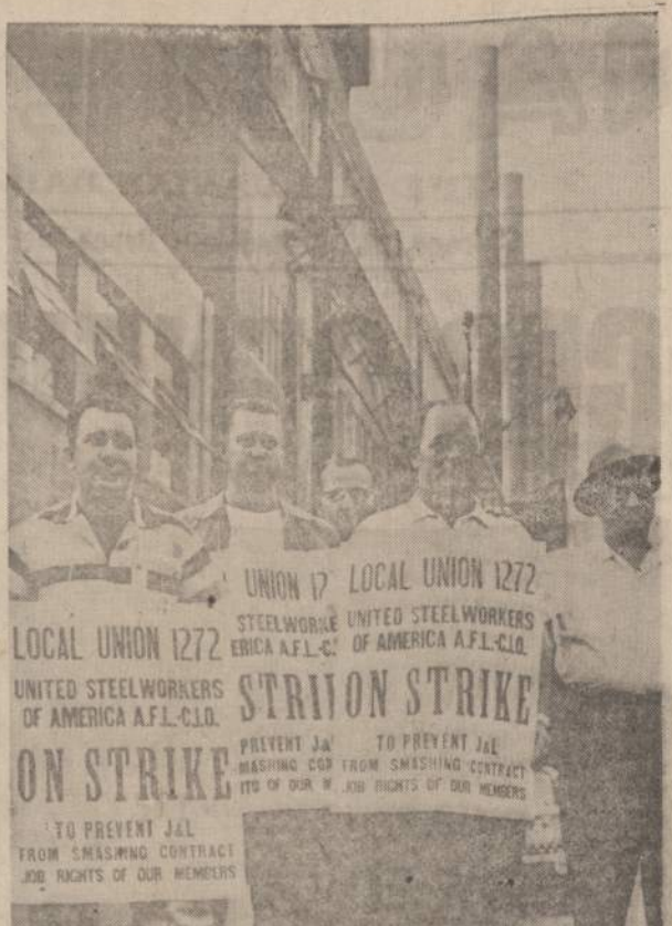
Pieno fabriky kaminal be dūmų Jones & Laughlin Steel kompanijoj Pitsburge, kai darbininkai streikui prasidėjus išstato piketus.

"Bet ar jūs žinote, kad šiandien su radiacijos pagalba jau galima išgydyti daugiau kaip 500 įvairiausių ligų", baigė daktaras kankinys, nusišypsodamas savo pusę veido.