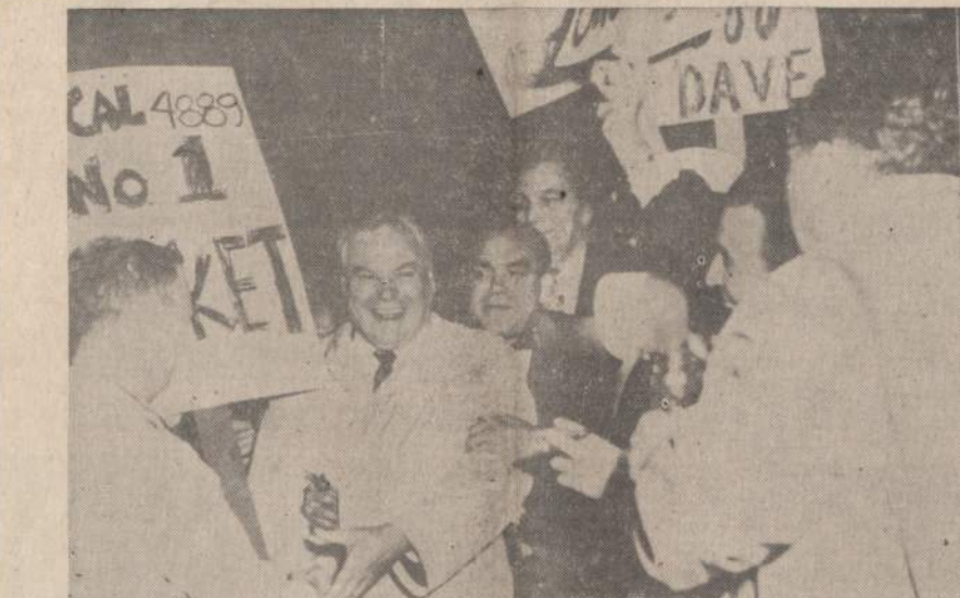
Amerikos plieno darbininkų unijos prezidentas David J. McDonald (antras iš kairės) Morrisville, Pa., dalyvauja streikuojančiųjų piketuose, gaudamas "Lokalo 4889 Pirmojo Numerio piketo" titulą.

Chicago prekybos sąjunga, patenkinta dabartinės prekybos pramonės parodos pasiekimu, nutarė parodą suruošti ir ateinančiais metais. Parodą per dieną aplanko iki 80,000 žmonių.