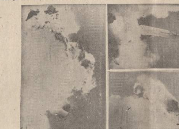
Armijos raketa Juno II (viršuje iš kairės) išsuauna iš pastovo ir (viršuje, dešinėje) virsta ir (apacioje) paneria pati savo liepsnose. Raketa buvo susprogdinta atsargos sumetimais, kadangi pasikeldama iš iškrypo iš savo kurso.