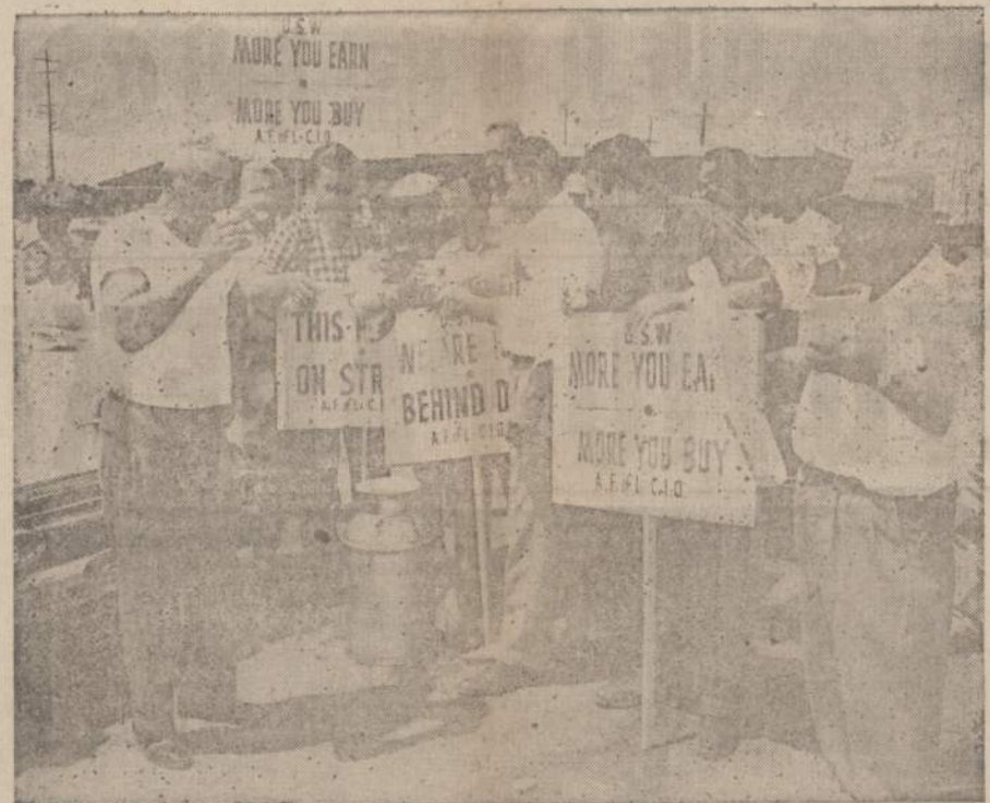
Streikuojančių Gary, Indiana, plieno fabriku piketai daro trumpą pertrauką kaval išgerti ir užsikęsti. Daugiau kaip 90,000 darbininkų Chicagos srityje yra pasiryžę ilgai kietam streikui.