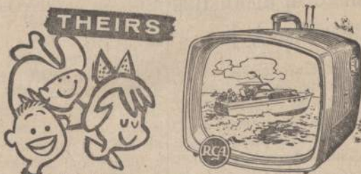
RCA VICTOR SPORTSMAN, portable TV with family-size screen—156 sq. in. picture. Choice of 3 handsome finishes. 170-P-03.

NOW! ENJOY YOUR FAVORITE PROGRAMS FROM BEGINNING TO END! NO ONE CLICKS DIALS BUT YOU. NEW RCA VICTOR PORTABLE TV IS THE IDEAL SECOND SET! LIGHTWEIGHT AND COMPACT! YOU CAN TAKE IT FROM ROOM TO ROOM OR ON WEEKEND TRIPS AND VACATIONS!