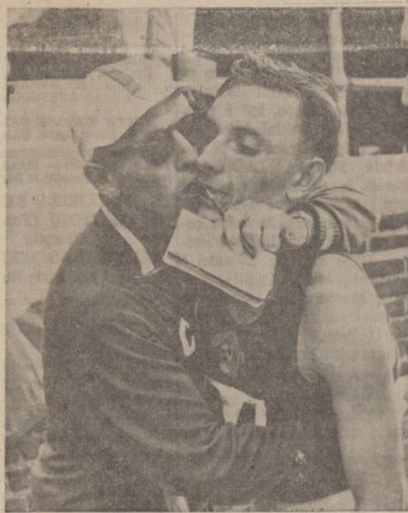
Aleksei Desiatčikov, sovietu Rusijos bėgikas, dalyvavęs SSSR-JAV 1,000 metrų (1 kilometro) distancijos bėgimo lenktynėse Franklin Field, Philadelphiajioje, kurį su laimėjimu sveikina kažkoks neišvardytas rusas.

Taisome keliamas duris Atliekam cemento darbus. Dedam pamatus Tuckpointing Pakeliam namą Plasteriavimas Atnuojam prieškąj Itaisom kambarius pastogėje Kambarius rūsyje Pristatom kambarius Vonioms ir virtuvėms