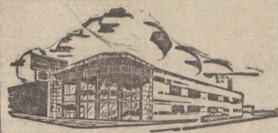
Chicago Savings and Loan naujoji įstaiga