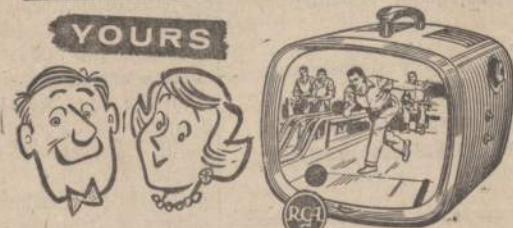
THE NOBLE, lowest-priced RCA Victor portable TV, 108 sq. in. picture. Ebony, 140-P-01.