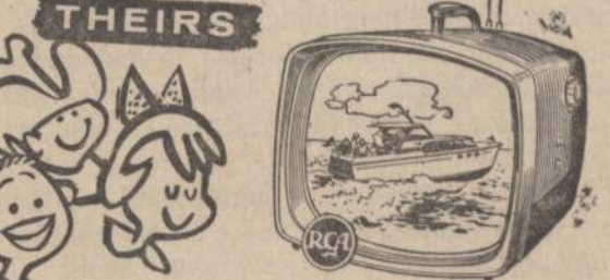
RCA VICTOR SPORTSMAN. Portable TV with family-size screen—156 sq. in. picture. Choice of 3 handsome finishes, 170-P-03.

NOW! ENJOY YOUR FAVORITE PROGRAMS FROM BEGINNING TO END! NO ONE CLICKS DIALS BUT YOU. NEW RCA VICTOR PORTABLE TV IS THE IDEAL SECOND SET! LIGHTWEIGHT AND COMPACT! YOU CAN TAKE IT FROM ROOM TO ROOM OR ON WEEKEND TRIPS AND VACATIONS!