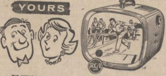
THE NOBLE. Lowest-priced RCA Victor portable TV, 108 sq. in. picture. Ebony, 140-P-01.

There's a compact RCA VICTOR Portable TV FOR EVERYONE IN THE FAMILY!