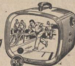
THE NOBLE, lowest-priced RCA Victor portable TV, 108 sq. in. picture. Ebony, 140-P-01.