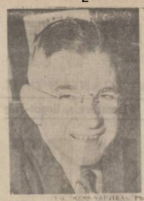
Buvęs vidaus sekretorius Douglas McKay mirė, sulaukęs 66 metų amž., ligėsnį laiką negalavęs širdimi.