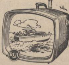
RCA VICTOR SPORTSMAN, Portable TV with family-size screen—156 sq. in. picture. Choice of 3 handsome finishes. 170-P-03.

NOW! ENJOY YOUR FAVORITE PROGRAMS FROM BEGINNING TO END! NO ONE CLICKS DIALS BUT YOU. NEW RCA VICTOR PORTABLE TV IS THE IDEAL SECOND SET! LIGHTWEIGHT AND COMPACT! YOU CAN TAKE IT FROM ROOM TO ROOM OR ON WEEKEND TRIPS AND VACATIONS!