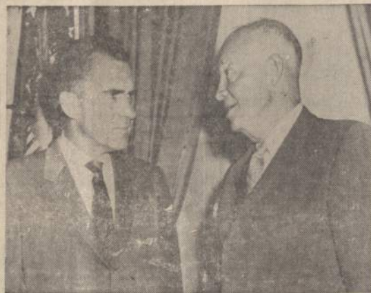
Viceprezidentas Nixon prieš išskrisdamas į Maskvą gauna iš prezidento Eisenhower paskutines instrukcijas.

Austrijos valdžiai teko pasiųsti policijos sustiprinimus, kad muštynės nebepasikartotų. Bet nėra garantijos, kad ji savo uždavinį pajėgs atlikti.