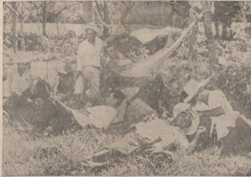
Kubos "campesinos" (valstiečiai) maršuoja į sostinę Havaną dalyvauti liepos 26 dienos iškilimėse, kuriose bus švenčiamos pirmosios revoliucijos sukaktuvės. Dėl karšto oro žmonės keliauja naktim.

Lietuvos ir kitų pavergtųjų tautų atstovų nuolatiniai kreipimosi į galingųjų pasaulio valstybių pareigūnus ir visuomenę nelieka be atgarsio, nors ir negalima laukti, kad Sovietai galėtų būti priversti