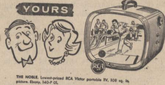
THE NOBLE. Lowest-priced RCA Victor portable TV, 108 sq. in. picture. Ebony, 140-P-01.

There's a compact RCA VICTOR Portable TV FOR EVERYONE IN THE FAMILY!