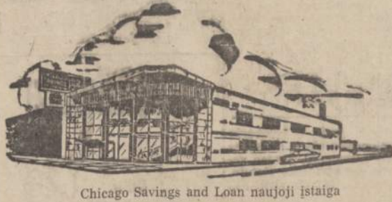
Chicago Savings and Loan naujoji įstaiga

ATDARA: Pirmadienį 12 iki 8, antradienį 9 iki 4, trečiadienį uždaryta visą dieną, Ketvirtadienį ir penktadienį 9 iki 8, šeštadienį 9 iki 12:30 val.