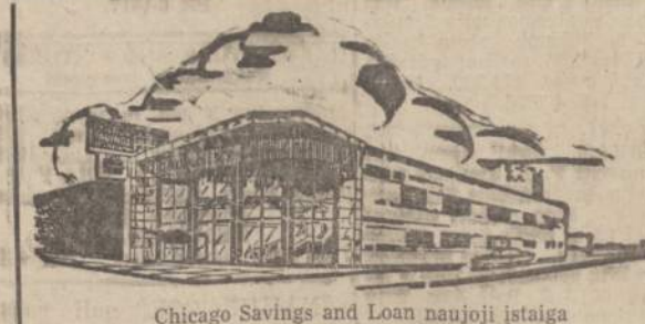
Chicago Savings and Loan naujoji įstaiga

CHICAGO SAVINGS TURTAS VIRŠ $35,000,000.00. Visų taupytojų pinigai yra pilnai apdrausti per Federalinės valdžios įstaigą. Visuomet išmokamas augštas dividendas. Perkantiems arba statantiems namus paskolos duodamos lengvoms sąlygoms. Taupytojams teikiama daug patarnavimų nemokamai. Kviečiame visus į vieną iš moderniausių ir įrengtų, Jūsų patogumui, finansinę įstaigą Chicagoje.