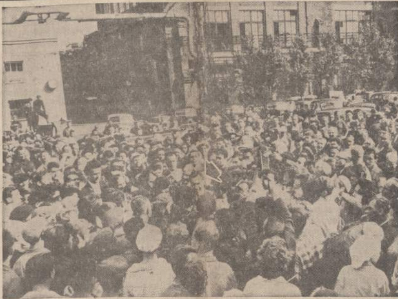
Viceprezidentas Richard Nixon Leningrado fa brike, kur jį apsupo darbininkai.

Dar kelios atskiros rezoliucijos Maltos laisvės reikalui. "Kongresas, remdamasis tautų apsisprendimo teisės principu, apgailestauja, kad Britai suspėdavo Maltos salos konstituciją, sunaikino Maltos demokratine tvarka ir grįžo prie absoliutinio viešpatavimo — priešingai didesnei Maltos gyventojų daugumos valiai, reikalauja gražinti Maltai demokratinę santvarką, kad gy-