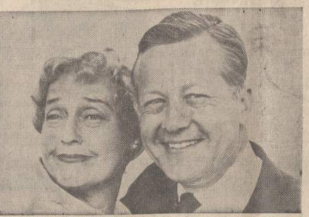
Laivu iš Europos grįžo Jeanette McDonald ir jos vyras Gene Raymond. Filmy garsenybės Europoje praleido atostogas ir tuo pačiu metu paminėjo savo vedybinio gyvenimo 22 metų sukaktį.