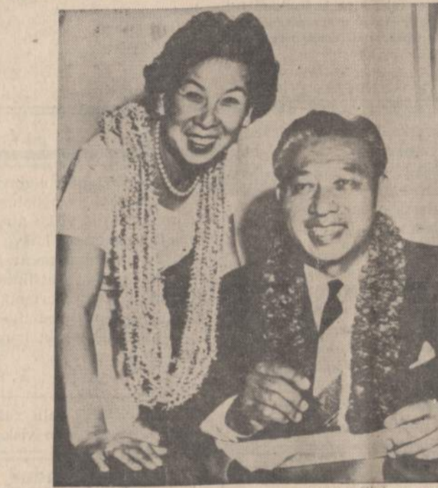
Hiram Fong, kinų klimės, kuris Hawaii rinkimuose laimėjo senatoriaus vietą. Jis yra respublikonas.