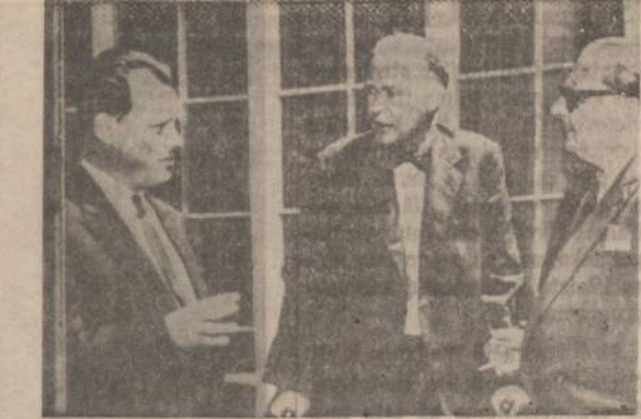
Vakaru Vokietijos užsienio ministeris Heinrich von Brentano su rengė priėmimą, kuriu metu buvo aptartas Berlyno klausimas. Dalyvavo (iš kairės į dešinę) Vakaru Berlyno burmistras Willy Brandt, JAV sekretorius Christian Herter ir von Brentano. Vakaru Vokietijos užsienio reikalų ministeris ir Willy Brand norėjo patirti, ar skleidžiami gandai, jog vakariečiai rengiasi sumažinti savo garnizonus Vakaru Berlyne, turi bet kokį pagrindą.

Sanatorija buvo gražiai pastatyta ir moderniškai įrengta. Čia dau-