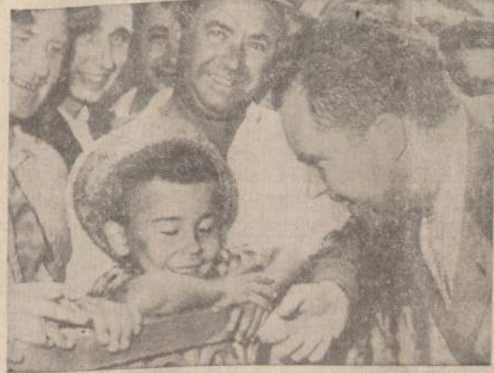
Viceprezidentas Richard Nixon kalbasi su berniuku besišypsiančiu rusų apsupty. Kalbėdamas pramoningame Sibiro mieste Sverdlovsk, Nixon padarė užuominą, kad gal Jungtinės Amerikos Valstybės aplankys sovietų premjerą Čruščiovas.

LONDONAS. — Anglų korespondentai, atvykę į aerodromą pasitikti karalienę, rašo, kad jie niekad jos nematė taip išvargus. Ji atliko 16,000 mylių kelionę po Kanadą ir Ameriką. Laikraščiai pataria geriau karalienę išsiųsti dažniau į britų bei likusių pasaulį, bet daug trumpesnėmis kelionėmis.