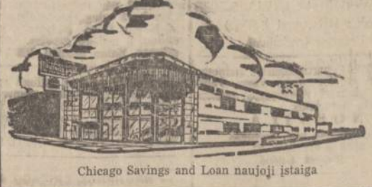
Chicago Savings and Loan naujoji įstaiga

CHICAGO SAVINGS AND LOAN ASSOCIATION 6245 South Western Avenue ATDARA: Pirmadienį 12 iki 8, antradienį 9 iki 4, trečiadienį uždaryta visą dieną, ketvirtadienį ir penktadienį 9 iki 8. Seštadienį 9 iki 12:30 val.