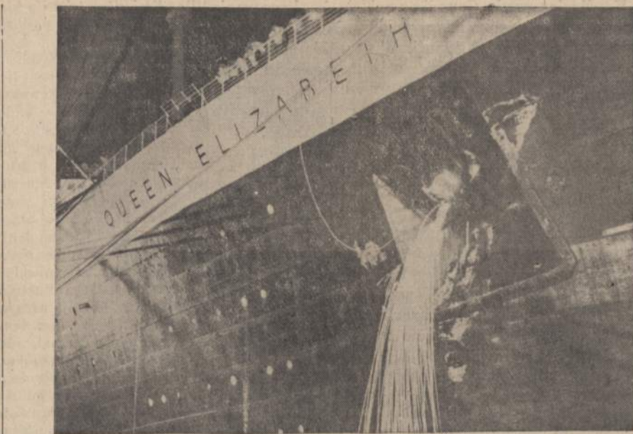
New York'o uoste yra taisomas Queen Elizabeth laivas, kuris netoli Conney Island susidūrė su Amerikos prakinio laivo iš žmonių niekas nenukentėjo. Queen Elizabeth su 1,959 keleiviais jau buvo pablaukęs į Angliją, kai įvyko susidūrimas.

daugiau kambarių butų modeliai. Būtų įtikėtina, kad tokioje butuose gyvena darbo žmonės, jei būtų paskelbta kiek faktinai tenka buto gyvenamo plotu kiekvienam Rusijos piliečiui. Dabar visiems yra žinoma, kad oficialiai skirta 9 kv. metrai gyvenamo ploto kiekvienam gyventojui. Deja, net oficialios Rusijos statistikos žinios rodo, kad nėra rusose tokio miesto, kur kiekvienas gyvenotjas naudotųsi tokio gyvenamo ploto. Jis žymiai mažesnis. Jei kas tiek ar daugiau, kaip 9 kv. metrus turi, tai tik naujai išaugusi raudonųjų buržuazija, bet ne darbo žmogus — valstietis ir darbininkas.