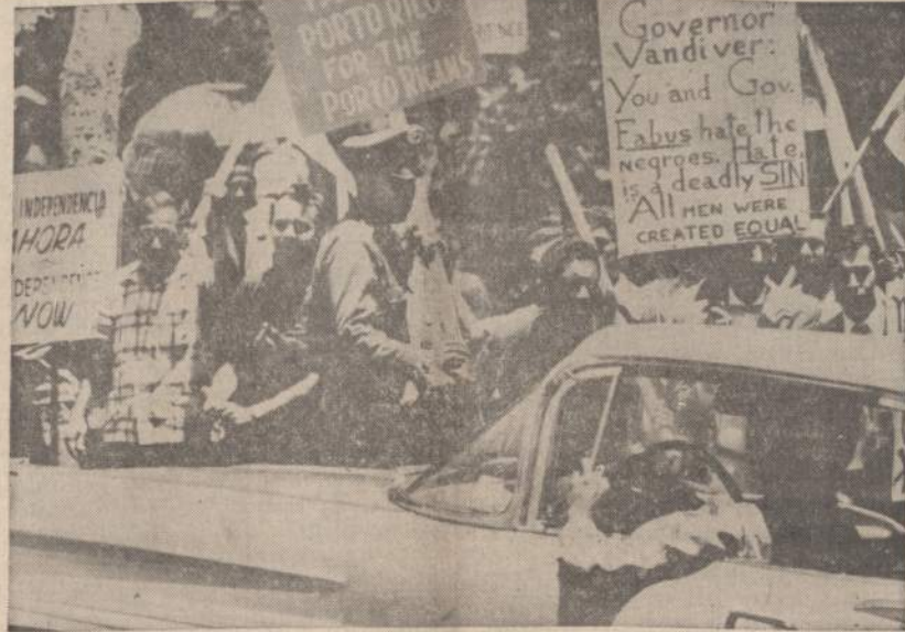
Amerikos gubernatorius, kurie suvažiuo į San Juan konferencijos laikyti, pasitiko grupę portorikiečių, kurie reikalauja Portorikai visiškos nepriklausomybės. Tačiau balsavimuose tie nepriklausomybės šalininkai surenka labai mažai balsų.

— Respublikinė žemės ūkio ir pramonės paroda Kaune, Ažuolyne, atidaroma liepos mėn.