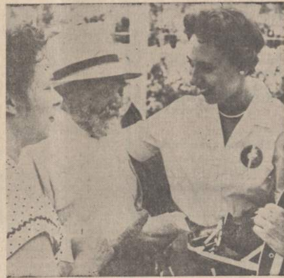
Senyvas rusas, kuris aplankė Amerikos parodą Maskvoje, buvo nustebintas, kai nuimta jo nuotrauka po minutės laiko jau buvo jam įteikta kaip suvenyras.

Indijos konsulo pastangos La-soje sutvarkyti padėtį, nedavė vaisių. Siūlymai perduoti reikalą spręsti Delhi-Peipingo vyriausybės buvo atmesti.