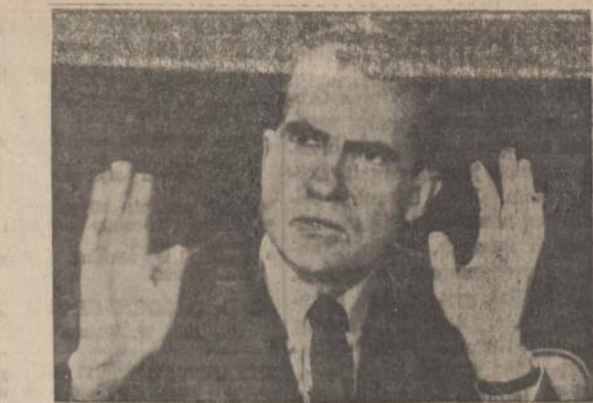
Viceprezidentas Richard Nixon per televiziją daro pranešimą apie savo kelionę į Rusiją.