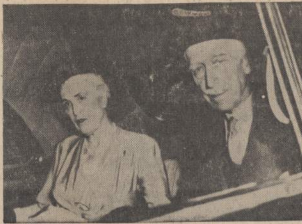
Generalas George Vanier, kurį Anglijos karalienė Elzbieta pasiskyrė Kanados generaliniu gubernatoriumi į vietą iš tu pareigų pasitraukiančio Vincent Massey. Jis drauge su žmona važiuoja į Buckingham rūmus, kur karalienė surengė jiems priėmimą.

Kas daugiausia nukentėcia Iš penkmečių planų matyti, kad daugiausia nukentėjo darbininkija ir ūkininkai. Darbininkijai darbo normas vis kėlė ir kėlė po šimtus pro-centų ir jų įvykdymui dienos darbo valandos savaime au-go. Dėl neįvykdytų aukštų normų žmonės buvo apkaltin-ti sabotazu ir, kaip liaudies priešai, pakliuvo į darbo sto-vyklas. Darbo stovyklose dau-gybė kalinių nuo ilgų darbo valandų, menko maisto ir blo-go buto, apsirgo ir nustojo darbingumo. Išlikusius pasiė-mė ganioti jau naujas parti-jos atstovas Chruščiovas. Ūkininkija, netekusi savo tė-vų prakaitu aplaistytos žemės nuosavybės, nustojo vilties ką nors geresnio atsiekti, numušė žemės ūkio gamybą iki mini-mumo, o atsistieję partijos atstovai pakeisti patyrusio ūkininko, dėl nesugebėjimo, ir žemę nuafino. Jie nesiskaity-dami nei su klimatu, nei su žemės rūšimi, nei su gyvulio bei paukščio prigimtimi, no-rėjo išgauti tai, ko diktatorius užsimanė nors ir prieš gamtą. Atsiradus dideliu maisto trūkumui, visą kaltę suvertė ant to seno ūkiniko, kaip ne-ištikimo buožės, ir už tai šis buvo nubaustas. O carų laikų inteligentija, kuri greičiau suspėjo užsimaskuoti ir išsi-saugoti, buvo naujo režimo stalinais, — molotovais, beri-jomis, višinskiais ir panašiai. Ir jie visi šiandien žiūri į už-sienį, kaip į išsigelbėjimą. Jiems, kol gyvi yra, gerai, ir savo tauta jie visai nesirūpi-na, nes dar per anksti, — pir-ma reikia tarpusavy susido-roti. O kad Sibire darbinin-