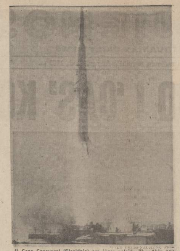
Is Cape Canaveral (Florida) oro jėgos paleido Thor-Able naujinę raketa su sparnais. Raketa aprūpinta instrumentais, kurie jau daro labai svarbius pranešimus iš stratosferos.