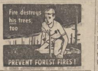
Fire destroys his trees, too. PREVENT FOREST FIRES! Pasirūpink savo ąraugus per "Naujienas".

NAUJIENOS 1739 So. Halsted Street, Chicago 8, Illinois