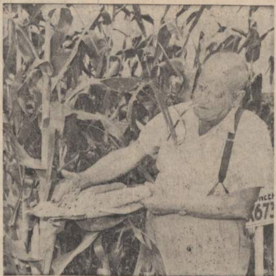
Roswell Garst, didelės fermos ir fabriko savininkas bei keliautojas savo fermoje prie Coon Rapids, Iowa. Nikita Chruščiovas išreiškė norą jo fermą aplankyti.

kvailą propagandą norėjęs daryti — susigėdo. Išėjo visi su pakais. Kai žydėlis prieš atsiveikinant pasakojo apie kokį tai milijonierių, kad jis baigęs jau penktą milijoną, vienas juokais atsėvė jam: Kai Krušėvas ateis čia, tada jam leis baigti iki dešimties milijonų. Visi skardžiai nusikvatojo. Pritarė jiems ir pardavėjai, bet man tas juokas buvo koks. Supratau, kas per juokus pasakota. Išėjus jiems iš krautuvės, ėmėsi mane aptarnauti. Baigęs pirktis einu gatve, židuri visas būrys "katiušių" irgi pirkinėjais. Pasipuošusių amerikoniškais rūbais. Vienai net gėlių vainikėlis apie kasą apdėtas. Atrodė, kad visai tos pačios manės, rodo jį alų ir sako vokiškai, kad tai yra tik "erzacas". Taip, pritariu jam. Nes tikrai jau šičia alum negali pasigirti. — Iš kur mokate vokiškai? — paklausiau. — Po kapituliacijos buvau rytų Vokietijoje, — atsakė ir dar pridėjo. — Man Europoje geriau patinka. Esu buvęs Prancūzijoje, Italijoje ir Belgijoje. — Kaip čia? Juk tikrai pirma kartą esate? — Čia nepatinka. Čia viskas erzacas. — Parodė jis ir medžiagų stirtą. — Visos medžiagos — erzacas. Žiūrėk, štai mano kostiumas iš Rusijos. — Jis pamėmė savąjį kostiumą už rankogalio ir atkišo jį man. Tada mandamas, kad nebus nemandagu, jei ir aš čiuptelėsiu jo tą "gerą" kostiumo rankovę, paėmiau, ir juokas pakuteno mano gerklę. Prastas ir gal net per daug prastas tas jo kostiumėlis. Susiraukęs pasakiau: — Taip, šitas jūsiškis, tikras erzacas. Nepriestaravo. Nusijuokė ir atrodė, kad suprato