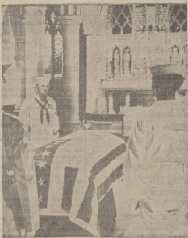
Admiralo William F. (Bull) Halsey kūnas pašarvotas Bethlehem koplyčioje Washingtono. Admirolas, kuris daugiausia prisidėjo prie japonų laivyno sunaikinimo, mirė eidamas 76 metus. Laidojamas Arlington nacionalinėse kapinėse.

Si komunistinė, praktiškai egzistuojanti, Rytų Vokietija šiandien turi 17.312.000 gyventojų. Tačiau jos gyventojų skaičius kasmet mažėja. Pvz., 1958 metais sumažėjo apie 100.000 žmonių (tiksliai — 98.963). Nuo 1948 m. rugsėjo mėn. iki 1950 metų pabaigos sumažėjo per 1.000.000 gyventojų (tiksliai — 1.076.493). Tai yra vienintelė valstybė (Europoje ir Azijoje), kur mažėja gyventojų skaičius, nes visur kitur didėja. (Ziur. Bulletin der Bundesregierung, Bon, 24 Juli 1959, Nr. 135/S, 1373). Mažėjimo priežastys — politiškos, nes dėl komunistinio režimo žmonės bėga į Vakarų Vokietiją. Šiuo metu iš Rytų Vokietijos į Vakarų Vokietiją yra perbėgę per 3.000.000 žmonių, kas žymiai pervirsija priegulį ir mažina bendrą gyventojų skaičių. Bėgimas eina toliau — bėga visų profesijų žmonės, — jaunimas, darbininkai, amatininkai, inteligentai — specialistai, daktarai, inžinieriai ir profesoriai, pvz. per pirmą 1959 metų pusmetį perėjo į Vakarų Vokietiją 455 profesoriai, asistentai ir mokytojai; 443 inžinieriai ir technikai; 161 gydytojas. Nuo gegužės mėn. 1958 metų iki gegužės mėn. 1959 metų iš Hale's-Wittenbergo universiteto perėjo į Vakarų Vokietiją 77 profesoriai ir docentai. Penkių metų laikotarpyje perbėgo 2763 daktarai. Intelligentių pajėgų bėgimas eina toliau, nežinint ten jiems teikiamų privi-