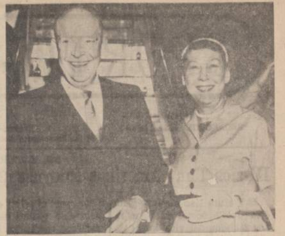
Prez. Eisenhower ir jo žmona prie spausdinio laktuvo, kuriuo jis išskrido į Vakary Vokietiją. Bonnoje jį pasitiko kancleris Adenauer. Prezidento atsilankymas sukėlė didžiausią entuziazmą tarp vokiečių.

ramesnės, taikingesnės ir be griežtesnių prikaišiojimų, kaip pasireiškėdavo praeities posėdžiuose. Reikia manyti, kad tai sušvelnino Eisenhower'io pakvietimas Chruščiovui atvykti į Washington'ą ir taip pat tas davė pagrindą pripažinti reikalą tolimesniems deryboms, o derybų ir vizitų eigoje sustabdė Sovietų grasinimą Vakary Berlyniui. Tas viskas davė pagrindą Vakariečiams atsistūti (bent iki Kalėdų), nes, kaip Gromyko konferencijos metu, taip ir Chruščiovas spaudos konferencijoje rugpjūčio mėn. 5 d. Maskvoje pareiškė, kad pasitarimu bei konferencijų metu Sovietai nesisims vienašališkų žygių dėl Vakary Berlyno (lai džiaugiasi kol kas tie, kurie dar jais tiki!). Tas sudarė konferencijos dalyviams užbaigimo, išsiskyrimo ir kelionės namo geresnę nuotaką.