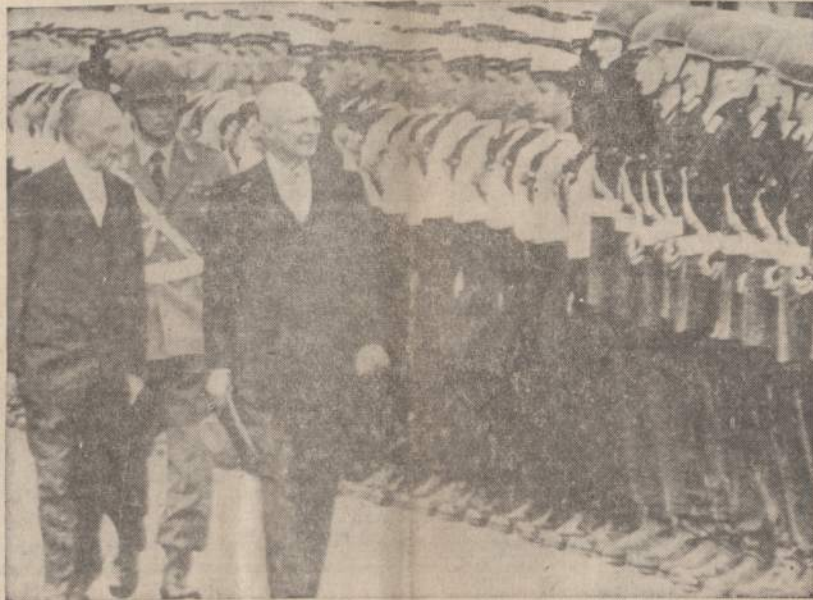
Prezidentas Eisenhower ir Vakarų Vokietijos kancleris Adenauer Bonnos aerodrome.