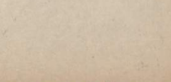
Chicago Savings and Loan naujoji įstaiga