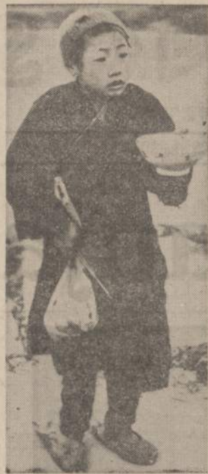
Paveikslas, kuris vaizduoja kinų vaiką, laikantį tuščią ryžių taure, turėjo būti pašalintas iš Amerikos pavieto Maskvoje, nes to reikalavo sovietų pareigūnai.