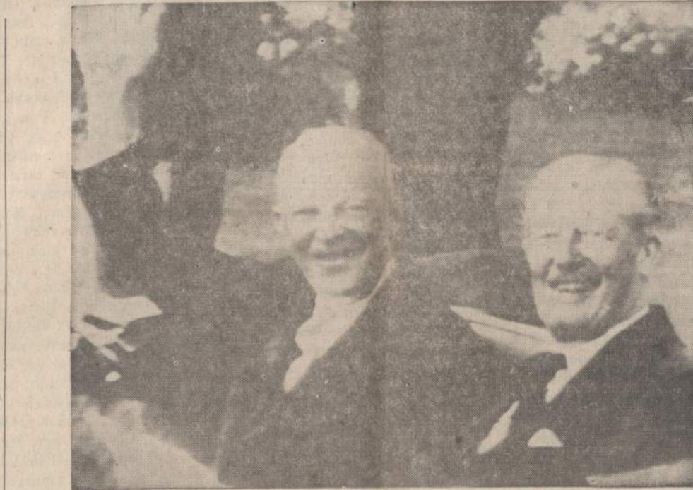
Prezidentas Eisenhower (kairėje) ir Anglijos premieras Harold Macmillan (dešinėje) važiuoja afidaramo automobiliuje Londono gatvėmis. Šimtai tūkstančių žmonių tiesiog su isterišku džiaugsmu pasitiko prezidentą.

DAWSON CREEK, Britų Kolumbija. — Čia leidžiamas laikraštis Dawson Creek Star randa vis didėjantį skaičių šalininkų, reikalaujančių, kad Kanados valdžia iš šiaurvakarių Teritorijų sudarytų atskirą provinciją, kadangi valdant iš tolimos Ottawos, šios teritorijos: yra labai skriaudžiamos ir negali net savo kelių pasistatyti. Vieno plano į naują provinciją įeity visos žemės į šiaurę nuo Britų Kolumbijos, Albertos ir Saskatchewano su 580,000 ketvirtainių mylių. Kanados provincijos turi savo atskiras legislaturas, maždaug tvarkosi kaip Jungtinių Valstybių steital.