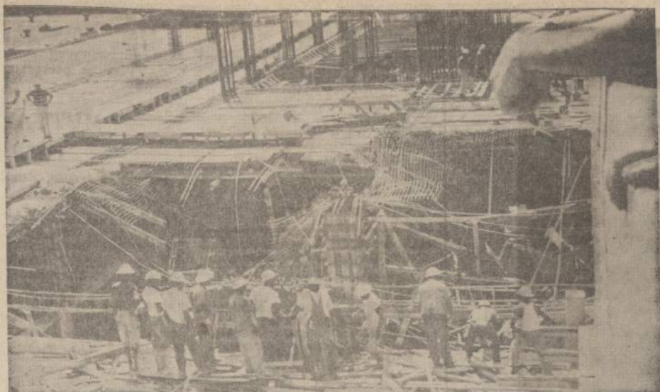
Dvidešimt antrame aukšte naujai statomo trobesio grindys įlūžo Atlanto mieste, Georgia valstybėje. Penkiolika darbininkų buvo sunkiau ar lengviau sužeisti ir vienas užmuštas.

Tačiau ir brangiausiose vietose pilna žmonių, atrodo, kad Vokietijoje turtingų žmonių yra daug. Žiūrint į gatvę, atrodo, kad čia neturtingų nėra — visi gerai apsirengę.