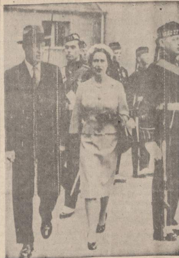
Prez. Eisenhower (kairėje) ir Anglijos karalinė Elzbieta žiūri į sargybą Balmoral rūmuose, Škotijoje. Karalinė, kuri buvo nusitarusi daugiau viešai nesirodyti, vis dėlto ta nutarimą sulaužė ir atvyko pasitikti prezidento Eisenhowerio.

"NAUJIENOSE" gali rašyti kiekvienas ir apie viską.