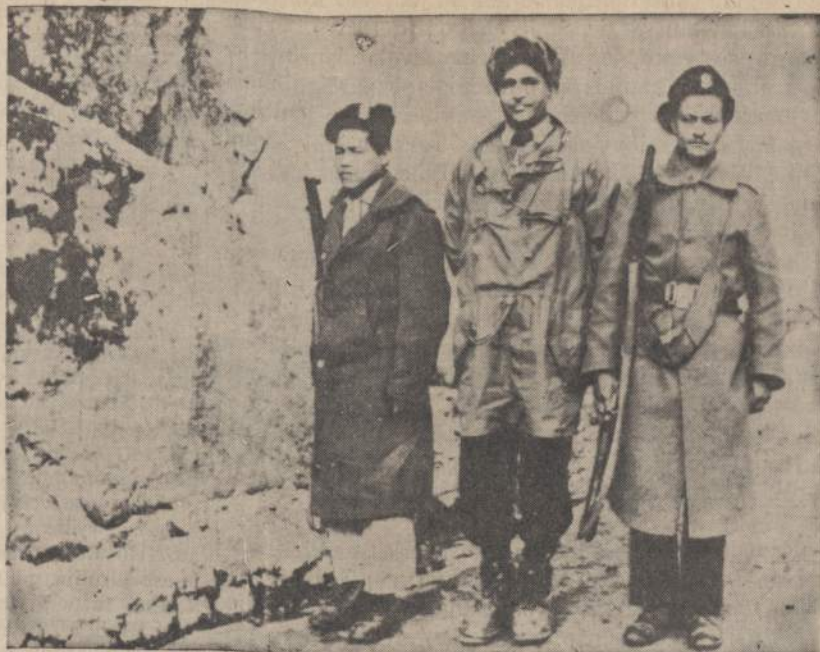
Keli Indijos pasienio sargybos nariai buvo užmušti ar sužeisti susirėmimo su komunistinės Kinijos kariuomene Šiaurinėje Teritorijoje.