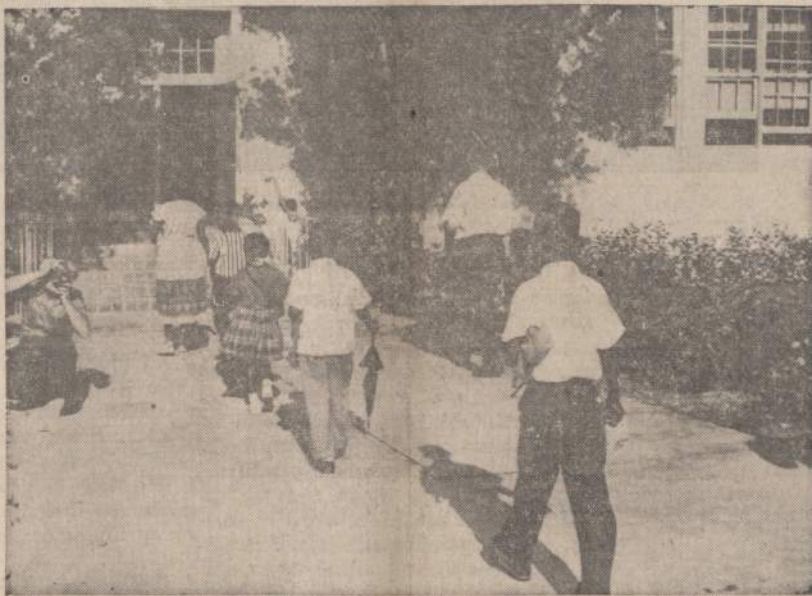
Miami (Floridoje) integracija mokyklose buvo pravesta ramiai. Negro vaikai pradėjo lankyti mokyklas, kurias pirmiau tik baltaodžių vaikai telenkė. Iki šiol neįvyko jokių nesuspriktimų.