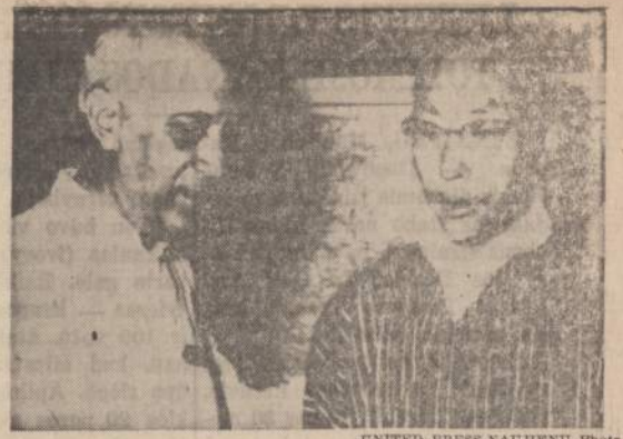
Indijos premieras Nehru (kairėje) kalbisi su Bhutano premieru Jigmi Dorji Juodu aptarė ginkluotus susirėmimus komunistinės Kinijos pasienyje.

Susibarė graikas su italų. — Iš Graikijos gi visi išminčiai ir filosofai kilo, sako graikas. — Tikra tiesa, atsakė italas, nes ten šiandien nė viena nelikio.