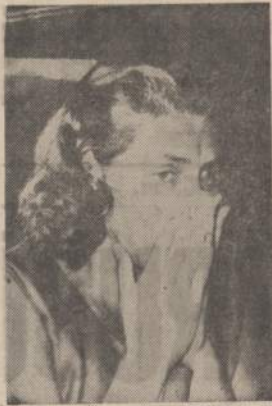
Ingrid Bergman, daug kuo pagarsėjusi švedų filmo artistė, verčia apiešdama Roberto Rossellini vilą Italijoje, kur gyvena jos vaikai, dėl kurių pasidalinimo ji tebeveda su Rossellini ilgą bylą teisme.