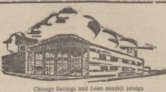
Chicago Savings and Loan naujoji įstaiga

CHICAGO SAVINGS TURTAS VIRŠ $35,000,000.00. Visų taupytojų pinigai yra pilnai apdrausti per Federalinės valdžios įstaigą. Visuomet išmokamas augštas dividendas. Perkantiems arba statantiems namus paskolos duodamos lengvoms sąlygoms. Taupytojams teikiama daug patarnavimų nemokamai. Kviečiame visus į vieną iš moderniausių įrengtų. Jūsų patogumui, finansinę įstaigą Chicagoje.