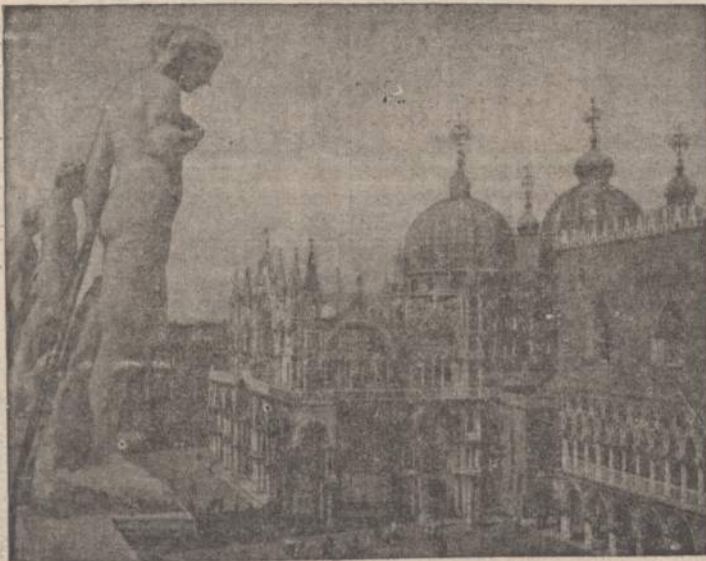
Venecijos kunigaikščių rūmai ir Sv. Morkaus bažnyčia. Venecija savo laiku buvo meno ir kultūros centras.