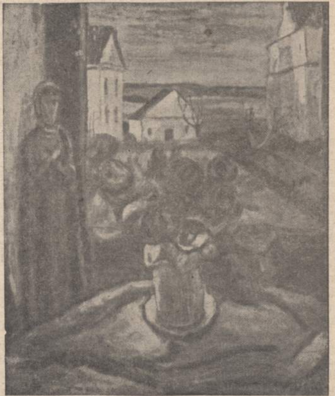
Dail. A. Valeška — Naturmortalas

Be ponios de Rambouillet Paryžiuje buvo dar šie garsūs salonai: panelės de Scudéry, ponios de Sablé ir ponios Scarron. Padėję formuoti kla-