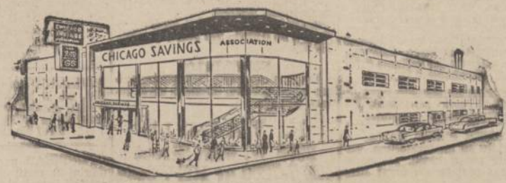
Chicago Savings and Loan naujaji įstaiga