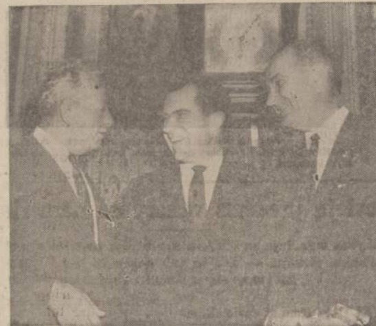
Rugsėjo 15 d., rytui auštant, Amerikos kongresas baigė savo 8 mėnesių sesiją ir išsiskyrė ilgesniu atostogų. Prieš pat išsiskirdamas dar spėjo baigti du kontroversišnius biilūs — civilinių teisų ir pagalbos kitoms šalims. Viceprez. Nixon (centre) kalbasi su mažumos vadu Everret Dirksen (resp., Ill.) ir daugumos vadu Lyndon Johnson (dem., Texas).