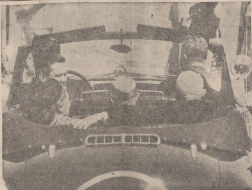
Sovietų premjeras Nikita Chruščiovas, JAV prezidentas Eisenhower ir Nina Chrusciovienė automobilio apiežidžia Andrews aerodroma, kur Chruščiovas su visa šeima ir 100 palydovų atskrido į JAV vizituoti.

Ir taip toliau. Tik į galą pakilo lokys ir pasiūlė "bolševikiškai" uždrausti visus ginklus ir legalizuoti tik vieną dalyką — pasaulinį, visuotinį apsikabinimą.