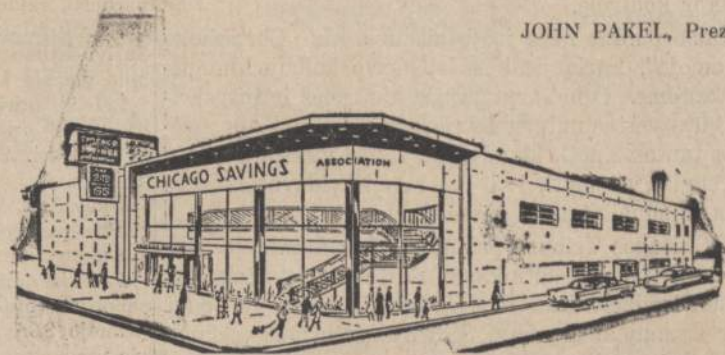
Chicago Savings and Loan naujoji įstaiga