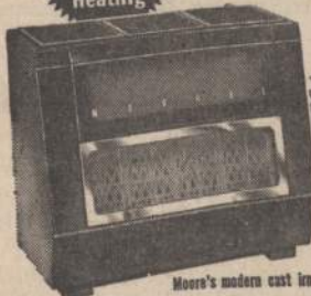
Moore's modern cast iron construction is guaranteed never to burn out!

A Lifetime of Low Cost Automatic Heating