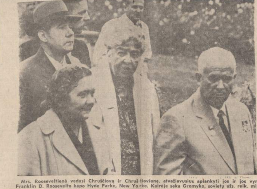
Mrs. Rooseveltienė vedasi Chruščiovą ir Chruščiovienę, atvažiavusius aplankyti jos ir jos vyro, Franklin D. Roosevelto kapo Hyde Parke, New Yorke. Kairėje sėka Gromyko, sovietų už. reik. min.