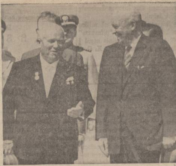
Sovietų premjeras Chrusčiovas, atskridęs didžiuliu sovietų lėktuvu TU-114, mosikuoja rankomis, kalbėdamas su jį pasitikusiu JAV prezidentu Eisenhoweriu Andrews aerodrome.

Hamiltono liet. mėgėjų teatras "Aukuras" dar šį rudenį žada paminėti 60 metų sukaktį nuo pirmojo lietuvių spektaklio Palangoje, kuris įvyko 1899 m. rugp. 20 d. Pasiruošimai jau vyksta.