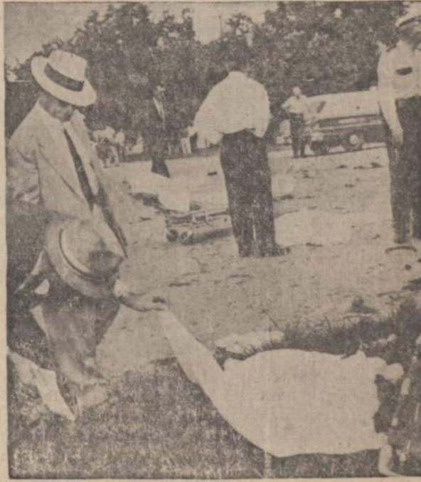
Depruoti padėjus čemodanuką su diramitu pradžia mokyklos kieme, Houston, Texas, nuo sprogių žuvo keturi vaikai ir du suaugę žmonės, kurių vienas, spėjama, buvo pats bombos aišnešėjas. Būrys kity nugalbenta į ilgonines, kai kurie kritiškai sužeisti, ir 26 žmonės sužeisti lengviau.

ir Illinois gubernatoriaus Stratton sveikinimu. Vėliau atstovai buvo paskirstyti į grupes, kad galėtų patirti naudingesnių žinių.