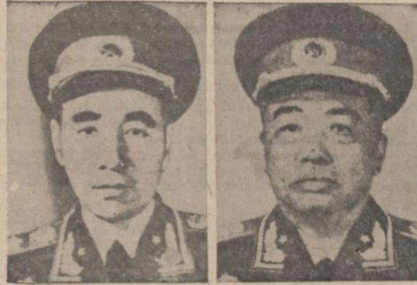
Maršalas Lin Piao (kairėje) paskirtas komunistinės Kinijos gynybos ministru, vietoje maršalo Peng Teh-Huai (dešinėje). Lin Piao skaitomas geriausiu kinų komunistų karo strategu.

Vienas žmogus norėjo gauti dirbtuvės sargą vietą ir užpildydamas prašymo formą į klausimą: Ar nebuvai baustas? parašė "Ne", o į sekamą klausimą, namatytą užpildyti tuo atveju jei buvai baustas, į klausimą "Kodėl?" žmogus nepagalvojęs parašė "Todėl, kad nebuvau pagautas".