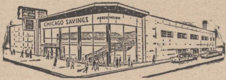
Chicago Savings and Loan naujoji įstaiga