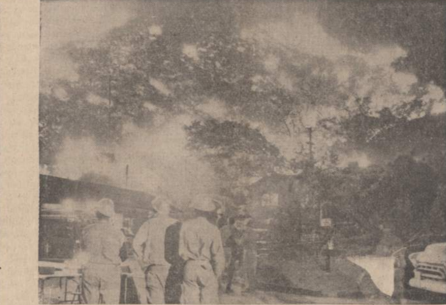
Vėl miškų gaisras Los Angeles užmiestyje nudegino apie 900 akrų plotą išilgai Angeles Crest plentą. Gaisrininkai saugo, kad vietomis užgesintų gaisras vėl neįsilepsnotų.

◆ Kubos valdytojas Fidel Castro pagrasino, kad jis imsis atitinkamų priemonių prieš Ameriką, jei ji nepirks Kubos cukraus, kiek ji turi parduoti.