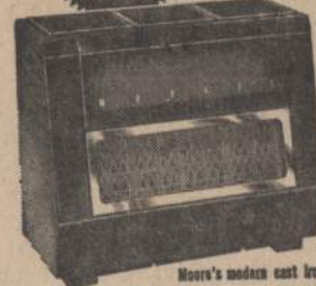
Moore's modern cast iron construction is guaranteed never to burn out!

Five popular sizes... a model for every heating need.