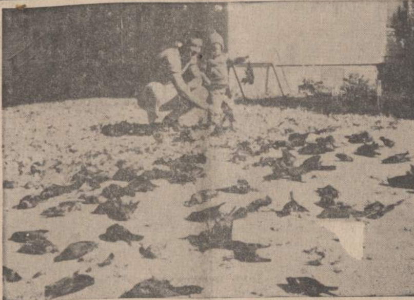
Grundy Center, Iowa, gyventojai, baigę "totalistinį karą" prieš žuokius (blackbirds), kurio metu sunaikino 4,000 paukštukų, dainuoja pergalės dainą "Bye, Bye Blackbird".

HEIDELBERGAS, Vokietija. — JAV armijos sargybiniai sukėmė Sovietų kariuomenės pulkininką ir jo šoferį uždraustoj vietoj, kur statoma Nike raketų bazė netoli Dallau. Kaip pagautieji aiškinosi, nežinia. JAV armijos atstovas pranešė, kad pulkininkas ir jo šoferis buvo paleisti po penkių valandų.