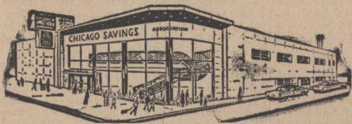
Chicago Savings and Loan naujoji įstaiga