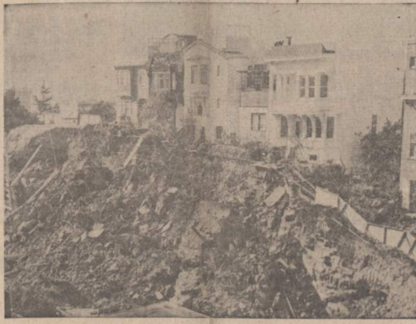
San Francisco priemiestyje penkių duplex apartamentų gyventojai buvo skubiai iševakuoti, kai besikasant pamatus naujam 16 aukštų namui žemės grūntas pradėjo nuslinkti. Inžinieriai tariaisi, kaip sustabdyti slinkimą ir apsaugoti tuos 5 namus.

Mirties sprendimą gali pakeisti atitinkami kariuomenės viršininkai.