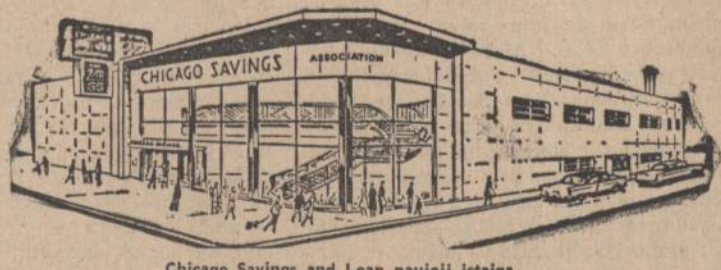
Chicago Savings and Loan naujoji įstaiga

CHICAGO SAVINGS AND LOAN ASSOCIATION 6245 So. Western Avenue Telef.: GRovehill 6-7575