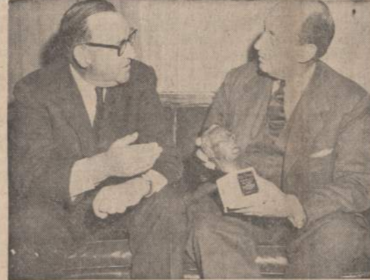
Kalifornijos gubernatorių Edmund Brown (kairėje) lanko Adlai Stevensoną Chicagoje. Abudu vengė pasisakyti, ar jie žada būti kandidatais nominacijoms į prezidentus.

Šių metų Nobelio premija už mediciną buvo paskirta irgi porai amerikiečių mokslininkų: daktarams Kornberg ir Ochoa. Pastarasis yra gimęs, augęs ir mokslus baigęs Ispanijoj.