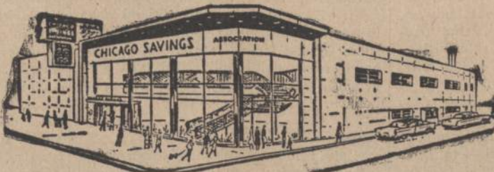
Chicago Savings and Loan naujoji įstaiga