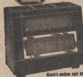
Moore's modern cast iron construction is guaranteed never to burn out

Five popular sizes... a model for every heating need.