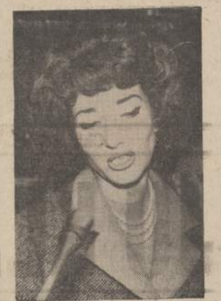
Soprano Maria Callas, atskridusi į New Yorką, suvaldė savo karštą temperantą, kai ją apsupo minia reporterių ir fotografų. Tai yra jos vizitas Amerikoje po to, kai jos vyras apkaltingai Callas romansuojant su graikų milijonieriu Onasis.