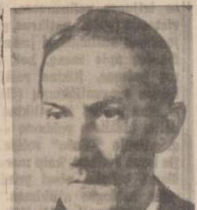
Čekoslovakų chemikas, prof. Jovanas Heyrovsky, gavo Nobelio dovaną už išradimą polar-grafinio metodo chemikalams analizuoti.

Tai dar kartą parodo, kad "turistų" kalbėtojai melavo, pasakodami apie "laimingą" žmonių gyvenimą okupuotoje Lietuvoje.