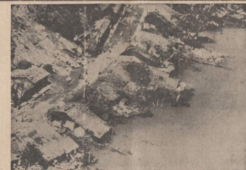
Meksikijoje siautė nepaprastas viesulas, kurio pasekoje žuvo šimtai žmonių ir padaryta nuostolių už milijonus dolerių. Čia yra Manzanillo kaimo vaizdas po to, kai praūžė viesulas.

"NAUJENOS" KIEKVIENO DARBO ŽMOGAUS DRAUGAS IR BIČIULIS.