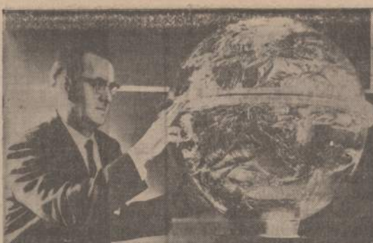
Mokslininkas egzaminuoja 130 svarų aliuminio dengtą balioną, kuris yra lyginai toks pat, koks buvo paleistas į erdvę iš Wallpo Island (Va.) paleistas balionas iškilo 250 mylių į erdvę ir paskui nukrito į jūrą.

O dabar šarlatonai, kurie tuos žmones nuskriaudė, bandė savo nešvaraus darbo išsiginti!