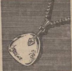
Precious Amber Nugget with Golden Rope Chain.

FASHION NEWS FROM PARIS GENUINE Amber GEM OF THE AGES