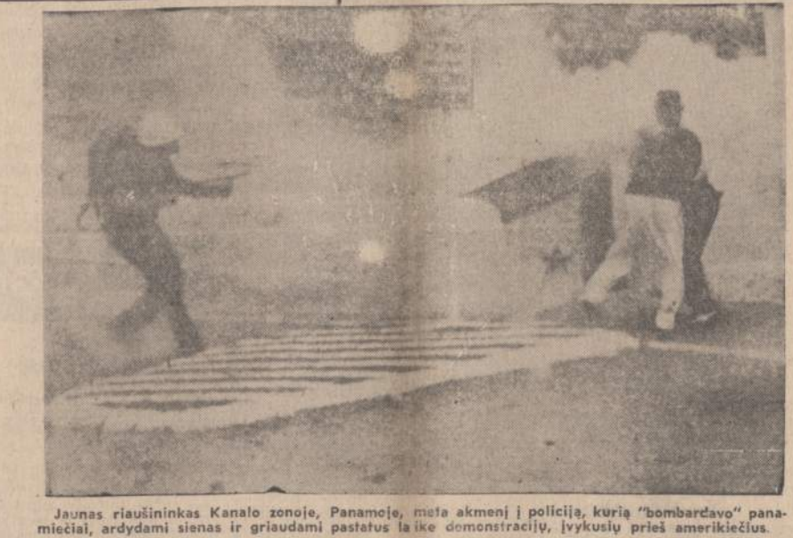
Juonas riušinininkas Kanalo zonoje, Panamoje, meta akmenį į policiją, kurią "bombardavo" panamiečiai, ardydami sienas ir griūdami pastatus laike demonstracijų, įvykusių prieš amerikiečius.

Jis buvo išrinktas į senatą 1941 metais ir nuo to laiko buvo nuolat perrenkamas. Jam buvo gana sunku išsitenkti partiniuose rėmuose, jis dažnai balsuodavo prieš Eisenhowerio vyriausybės projektus. Bet kadangi, kaip buvęs N. Dakotos gubernatorius, lengvai įveikdavo demokratų kandidatus, respublikonų partija turėdavo jį vistiek remti.